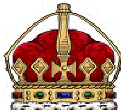
Krono de la princo