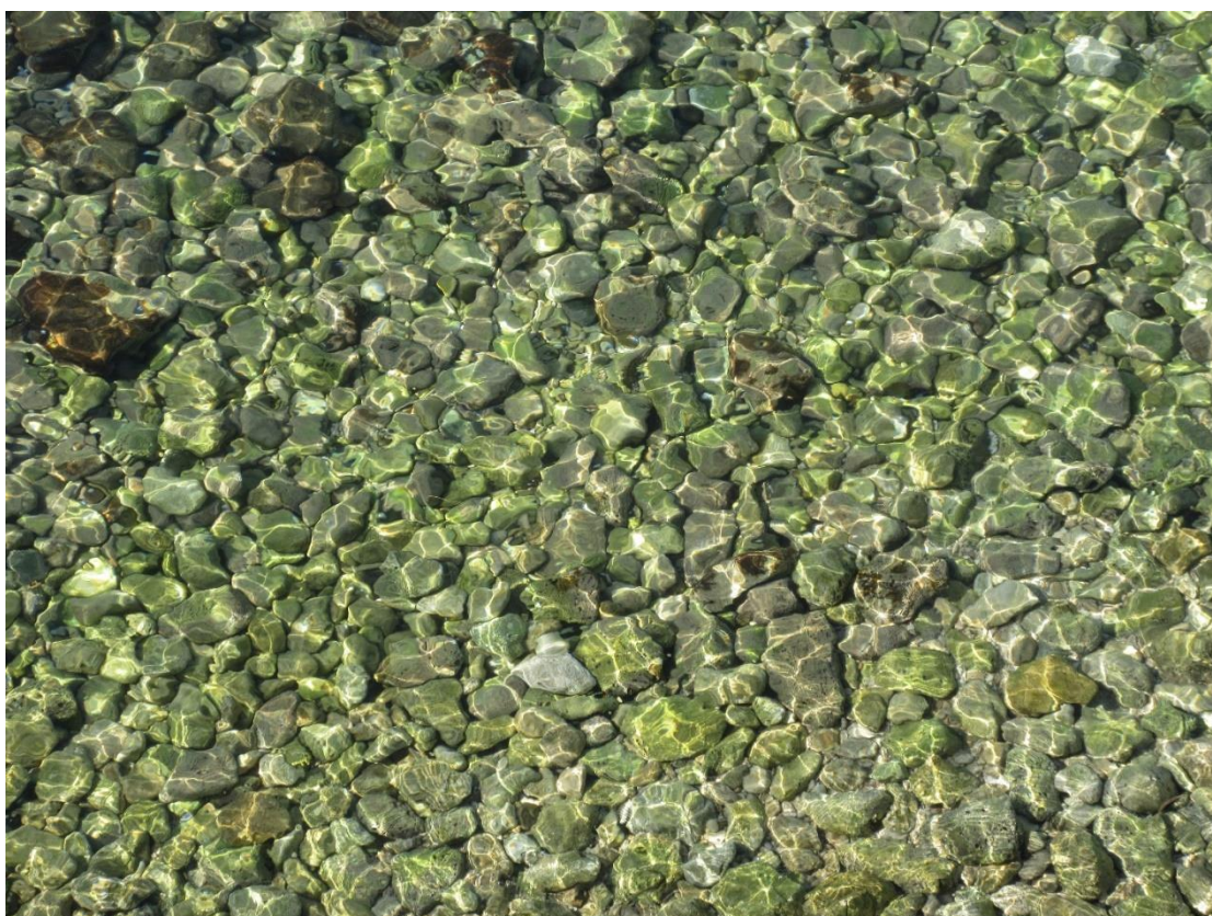
Akvo, ondoj, ŝtonetoj kaj lumo ĉe la marbordo apud Dramalj, komunumo Crikvenica [crikvénica].