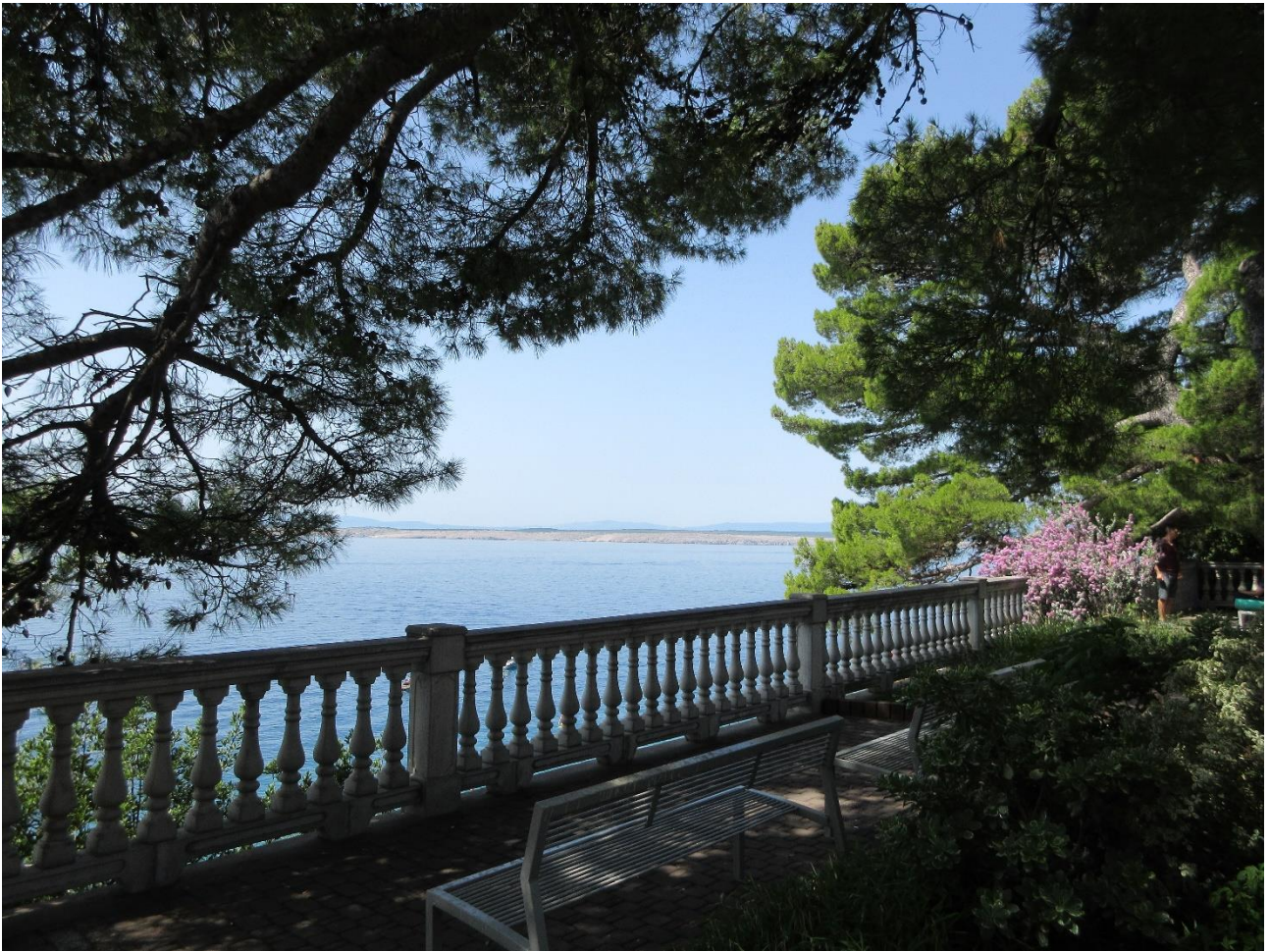
Rigardo de Dramalj al la insulo Krk