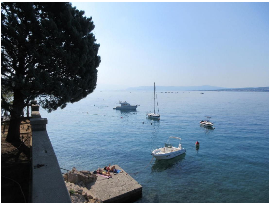
La maro antaŭ Crikvenica