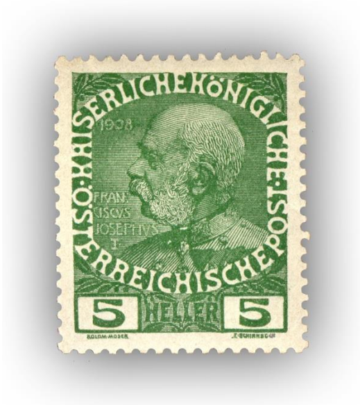
Poŝtmarko, Kolo Moser, 1908. Sur la bildo imperiestro Francisko-Jozefo.

Usona Koktelejo, American Bar aŭ Loos-Bar; ĝi troviĝas en la unua distrikto de Vieno, en Kärntner Durchgang.