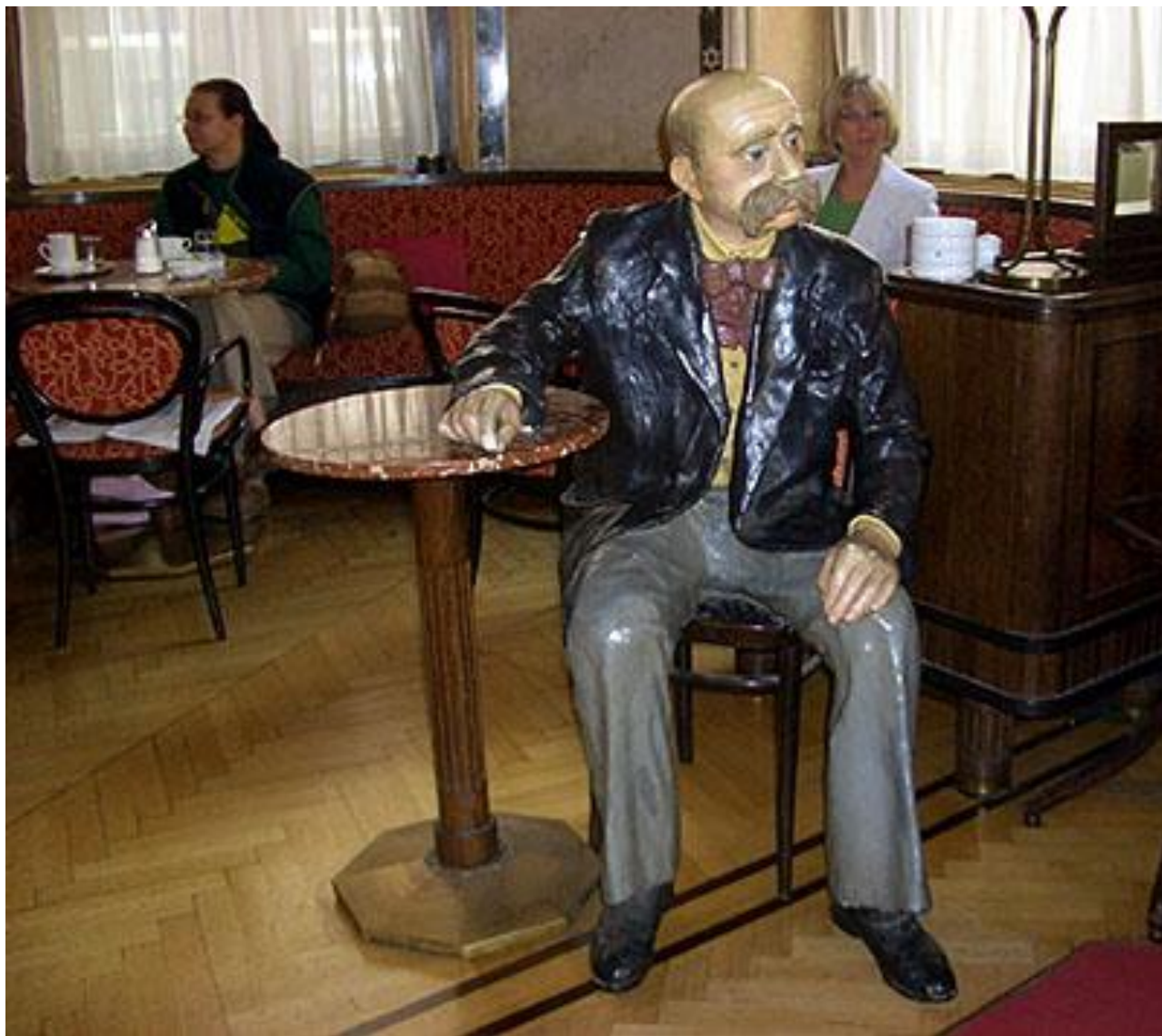
Altenberg-Pupo en Kafejo Central, Vieno, unua distrikto.

Altenberg estis petema kaj ŝparema, sed ne avara. Kiam li mortis en 1919 li heredigis grandan sumon - 107 834 kronojn - al viena porinfana asocio. Krome li posedis 10 000 bildkartojn, kiujn nun havas la Historia Muzeo de Vieno.