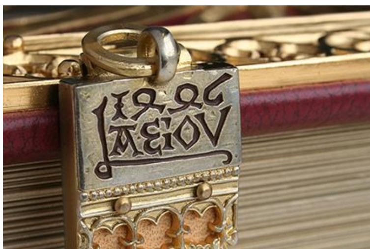
La fermilo de tiu libro kun la literoj AEIOU kaj la jarindiko 1446