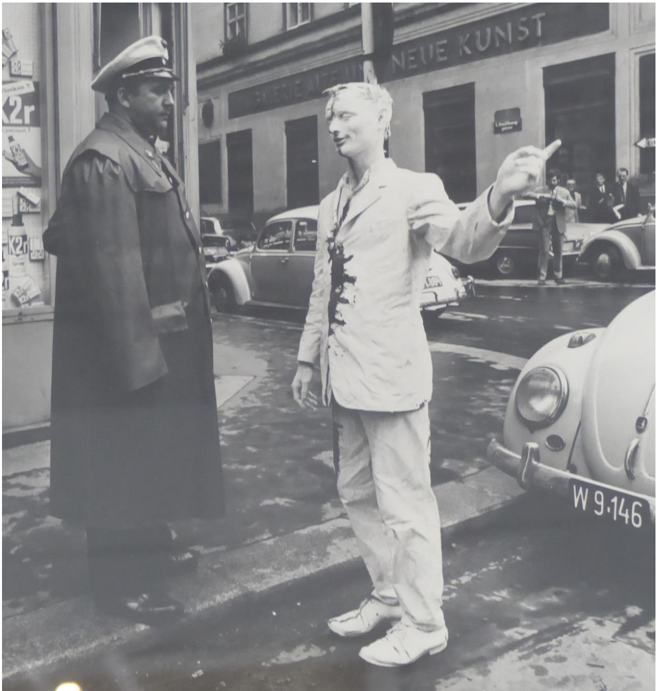
Günter Brus 1965. „Promenado en Vieno“

Pro “ekscito de publika skandalo“ Brus devis pagi punon.