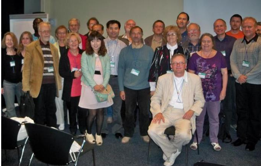
Treffen von esperantosprachigen Journalisten in Kopenhagen

Der Journalisten-Weltverband Tutmonda Esperantista Ĵurnalista Asocio , kurz TEĴA, wurde 1946 in Schweden gegründet und 2008 in Vilnius neu organisiert. Als juristische Persönlichkeit wurde er 2008 in Litauen registriert.