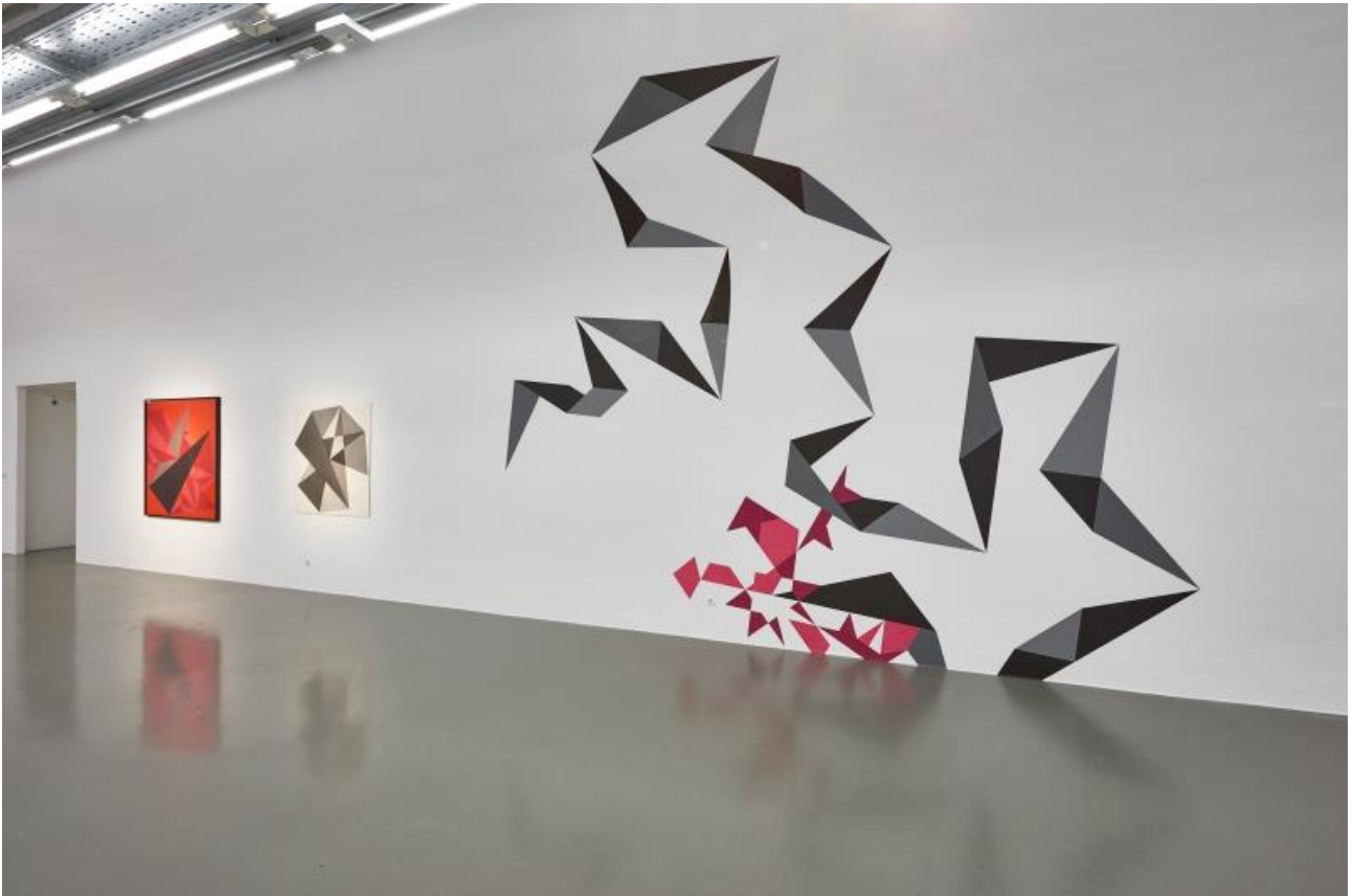
Bildo 4 MAK-ekspozicio, 2018 Adriana Czernin. Fragmento MAK Galerio. Kopirajto de la foto MAK/Georg Mayer