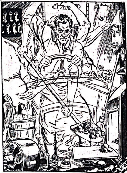
La laboro estas universala motoro

Fervore ŝi aranĝas monkollektadojn, kiuj atingas baldaŭ atentindajn sumojn, por niaj kuraĝaj batalantoj. Antaŭ kelkaj tagoj ŝi aperis nekutime pala. Kial? Ŝi sciis, ke oni bezonis volontulojn, kiuj donacu sian puran sangon por gravaj vunditoj. Oni ana-