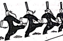
La Komitato ekzercas pri la ansera palmarono

pregantoj, kiuj stultigas la noblajn impulsojn kaj sanktajn fervorojn de siaj regatoj per frazoj perdidaj! Ĉiujn intergatojn de rotoj, la konversacioj komenciĝas, k nun vigle ekvivis la ekdekvia kunagado, sub minimuma komuna programo.