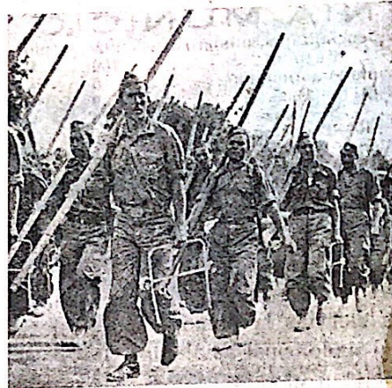
Sanitaraj brankardistoj en la fronto

● Oni scias absolute fidinde, ke la poliestro de Franko havas dikajn tekojn, kiuj entenas pli ol unu milionon da slipoj. Tiu «nigra» listo devenas de antaŭ ol la milito k ĝi detale mencias la nomojn de ĉiuj personoj iomete elstaraj en respublikanaj k laboristaj organizoj. Kiam la faŝistoj konkeras iun urbon aŭ vilaĝon, tuj oni serĉas la koncernajn enlistitojn, kiuj suferas rapide la morton aŭ la enkarcerigon. Tiel sekrete oni gardas la enhavon de tiuj teruraj listoj, ke neniu scias pri sia tiea esto aŭ mal-esto. Tie, ĉie regas angoro simila al mezepokaj tempoj de la Inkvizicio.