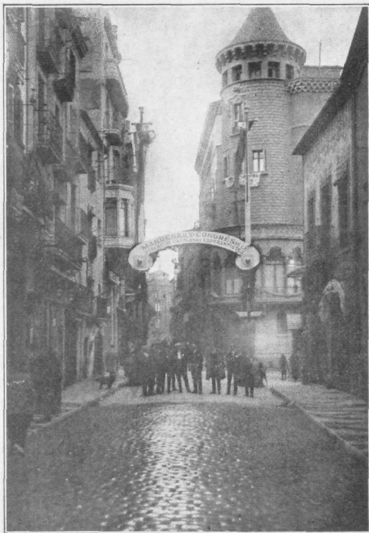
Triumfa arkajo, ĉe strato Born, starigita de la Ur- bestro honore al la esperantistoj.