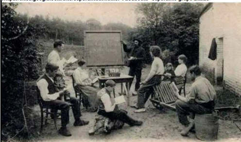
D.V.O. 12439 Clase de Esperanto al aire libre. Año 1906. Stockel-Bois (Belgica)

CURSO TRIMESTRAL (Febrero-junio 2020). Viernes 19:30h-21h. Plazas limitadas 13 alumnos. ENSEÑANZA GRATUITA excepto material del curso: diccionario Español-Esperanto/ Esperanto- Español y libro de aprendizaje Hessa metodo 30 €. INSCRIPCIÓN por correo electrónico: esperantobi@gmail.com o por tño 656776065 (David) GRUPO ESPERANTISTA DE BILBAO. C/ Barrenkale Barrena 7-1ª dcha - Bilbao (fundado en 1906) https://sites.google.com/site/esperantobi/home . Facebook: "esperanto grupo Bilbao"