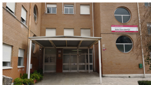
IES Caro Bajora, uno de los institutos participantes

El concejal de Educación, Isidoro Ortega, ha explicado los objetivos de esta actividad: «se trata de que los alumnos y alumnas se acerquen al ámbito del debate, practiquen habilidades de oratoria y pierdan el miedo a hablar en público, a la vez que fomentan su capacidad para trabajar en equipo y su pensamiento crítico, herramientas estas imprescindibles hoy en día en el ámbito laboral».