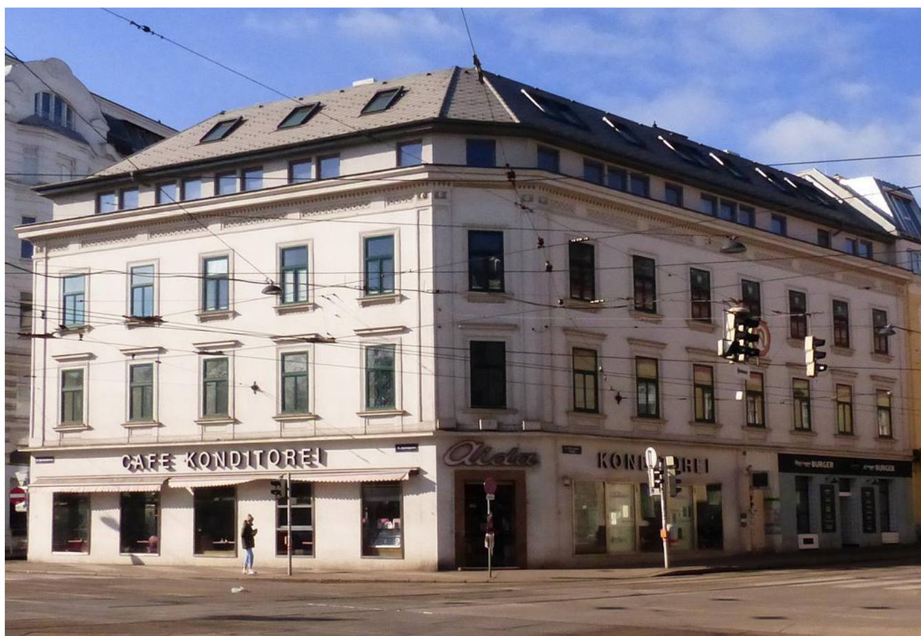
La kafejo AIDA

La aktualajn informojn vi trovas per Eventa Servo eventaservo.org