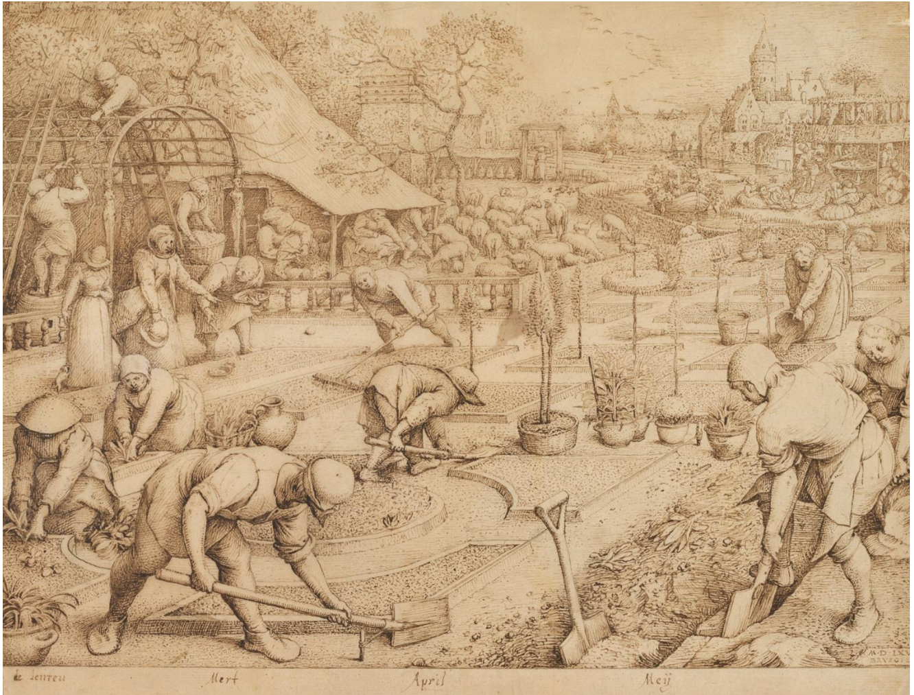
Pieter Bruegel der Ältere Der Frühling, 1565, La printempo Feder in Braun, auf Papier Pluma disegno bruno; suir papero Albertina, Wien