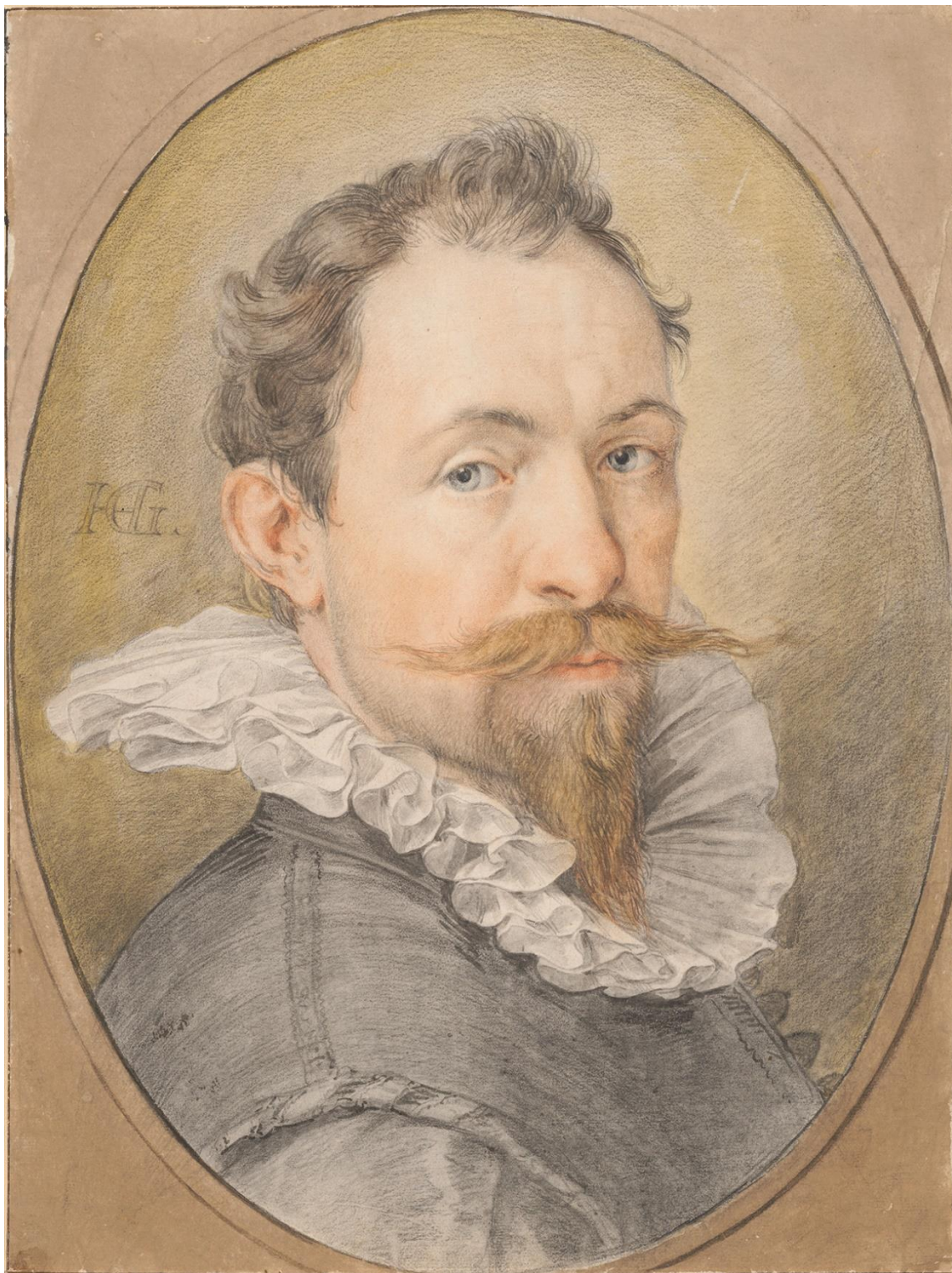
Hendrick Goltzius Selbstbildnis, um 1593–1595, memportreto Kreide, Aquarell, Pinsel; auf Papier Kreto, akvarelo, peniko; sur papero Albertina, Wien