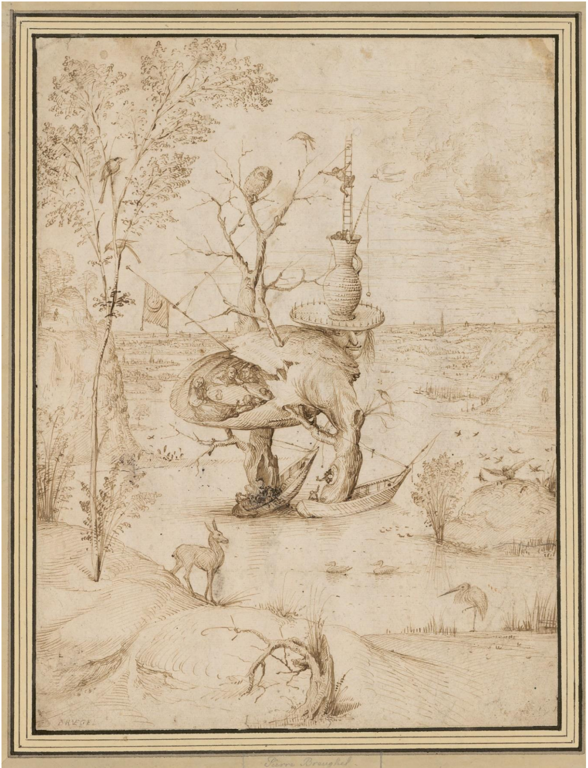
Hieronymus Bosch Der Baummensch, um 1500, La arba homo Feder in Braun, auf Papier. Plumo brune; sur papero ALBERTINA, Wien