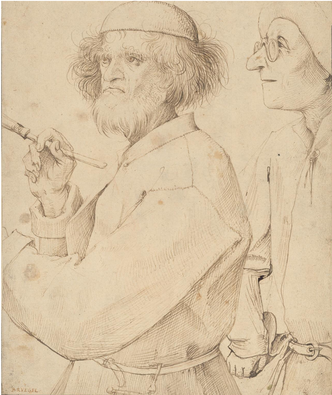
Pieter Bruegel d. Ä. Maler und Käufer, um 1566, Pentristo kaj aĉetonto Feder in Braun, auf Papier Bruna pluma desegnaĵo; sur papero ALBERTINA, Wien