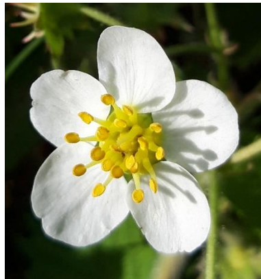
Floro de frago fotita de Irene Klag 2020

Bitte beachten Sie auch die folgenden Seiten