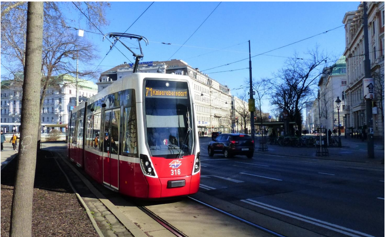
Sur Ringstrato videblas nun la plej moderna Viena tramo. Linio 71, tipo D. Fotita sude de la haltejo Schottentor (Skota Pordego).