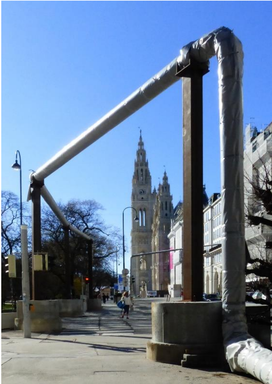
La tubo kaj Rathaus.