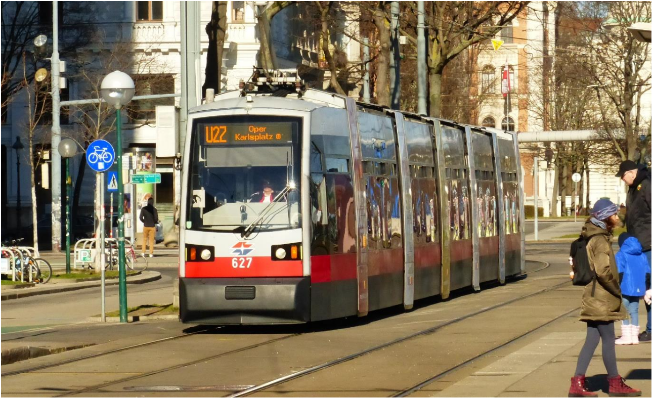
Dum la konstrulaboroj la tramlinio U2Z anstataŭigas la metrolinion U2. Fotita antaŭ Ringturo.