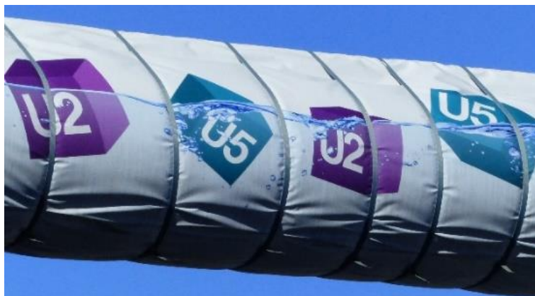
La tubo sep metrojn super la stratnivelelo.