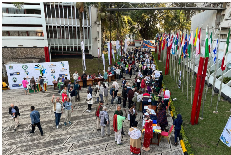
Dum la Movada Foiro. Fotis: Martina Sachs-Bockelmann , KN 248