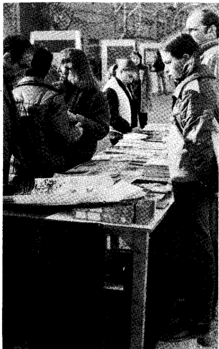
La publiko atente rigardas la librojn

En la plej centra parto de la Avenuo, barita por la trafiko, la Festo komenciĝis je la deka matene per senpaga disdonado de fandita ĉokolado al ĉiuj parto-