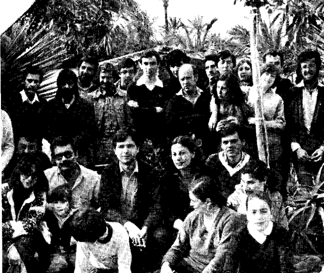
Partoprenantoj en la H.E.J.S. tendaro.