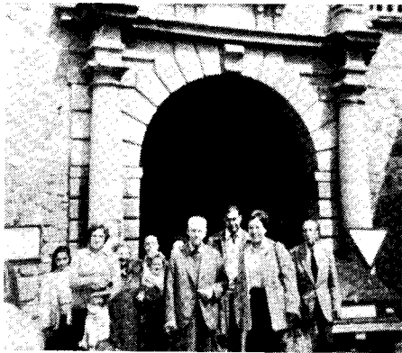
Grupo de geparatoprenantoj en la ekskurso al Toledo.