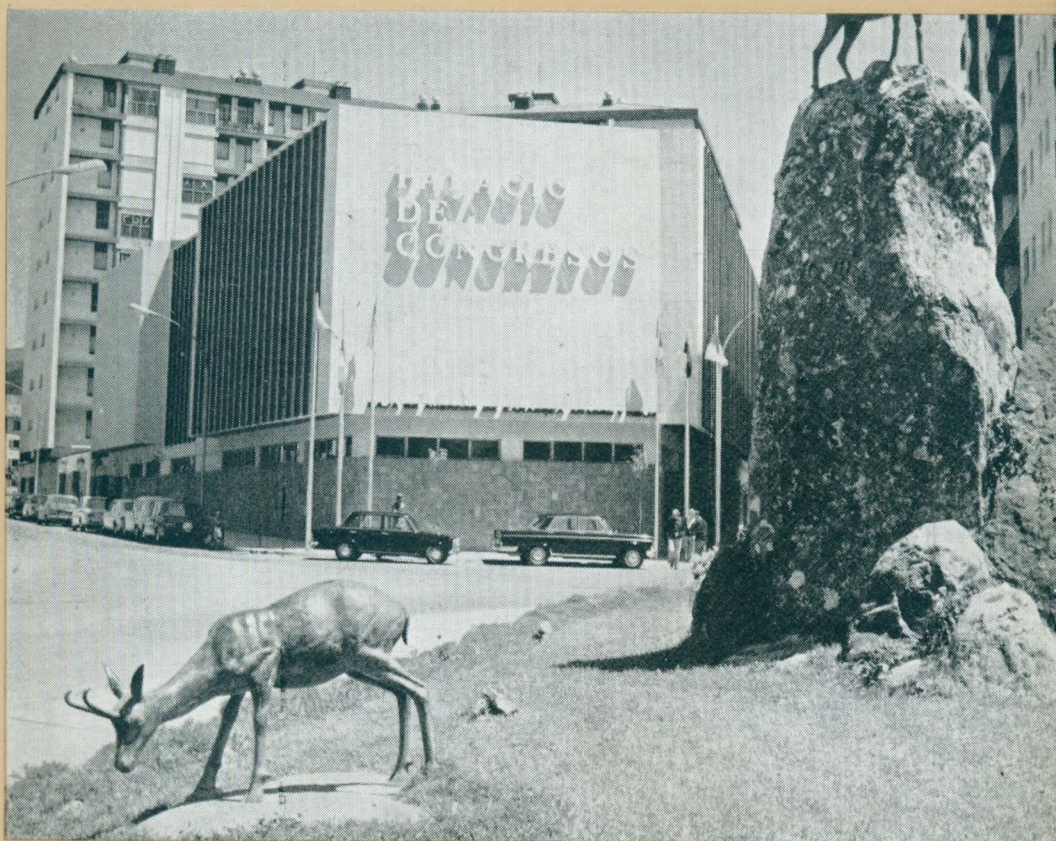
PALACO DE KONGRESOJ