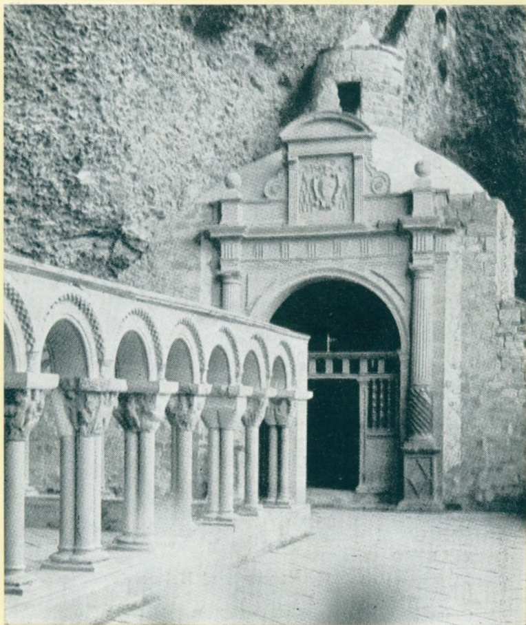
SAN JUAN DE LA PEÑA Klostro interne de la roko