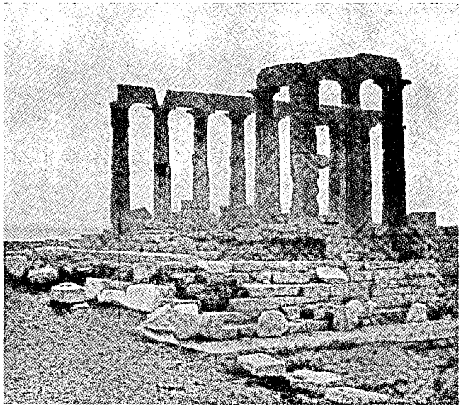
Templo de Posidono sur promontoro Sunio

En Grekujo naskiĝis la arto kaj la scienco... la pensado kaj sentado de l' modernaj popoloj. La verkoj de ĝiaj poetoj, pentristoj, skulptistoj kaj arkitektoj estas ankoraŭ eternaj modeloj de artistoj.