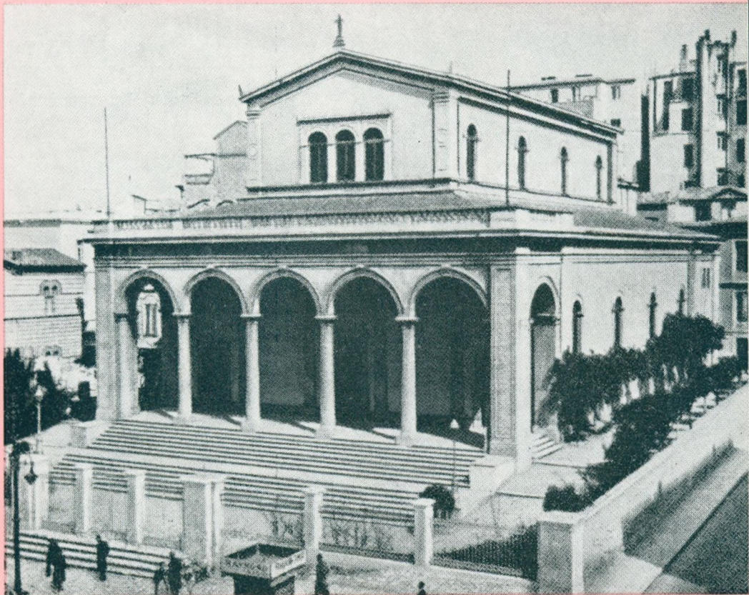
ATENO: DIONIZIO KATEDRALO