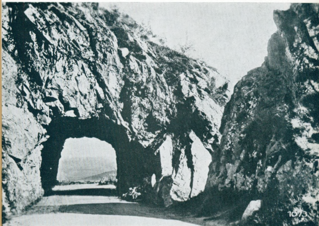
Pasejo de la «Schlucht» (Francujo)