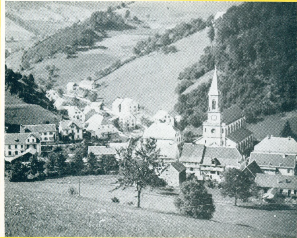
Vilaĝo "Le Bonhomme" (700 m. - Alta Rejno)