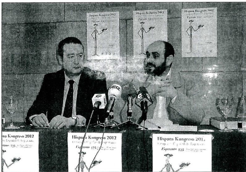
El alcalde de Almagro y el presidente de la Asociación de Esperanto de Castilla-La Mancha

"Sobre el esperanto destacó que es el idioma más tolerante del mundo, "un idioma que nace con la idea de derribar fronteras". □