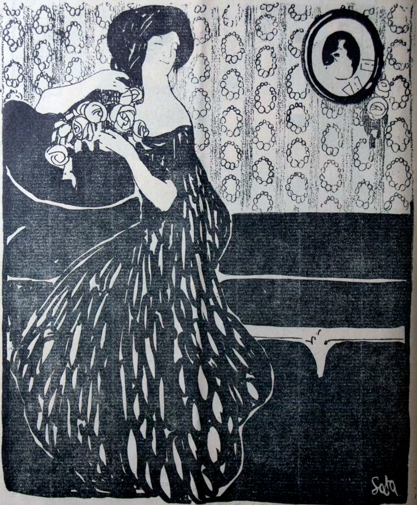
—Kun kia ĝojo mi pentus!