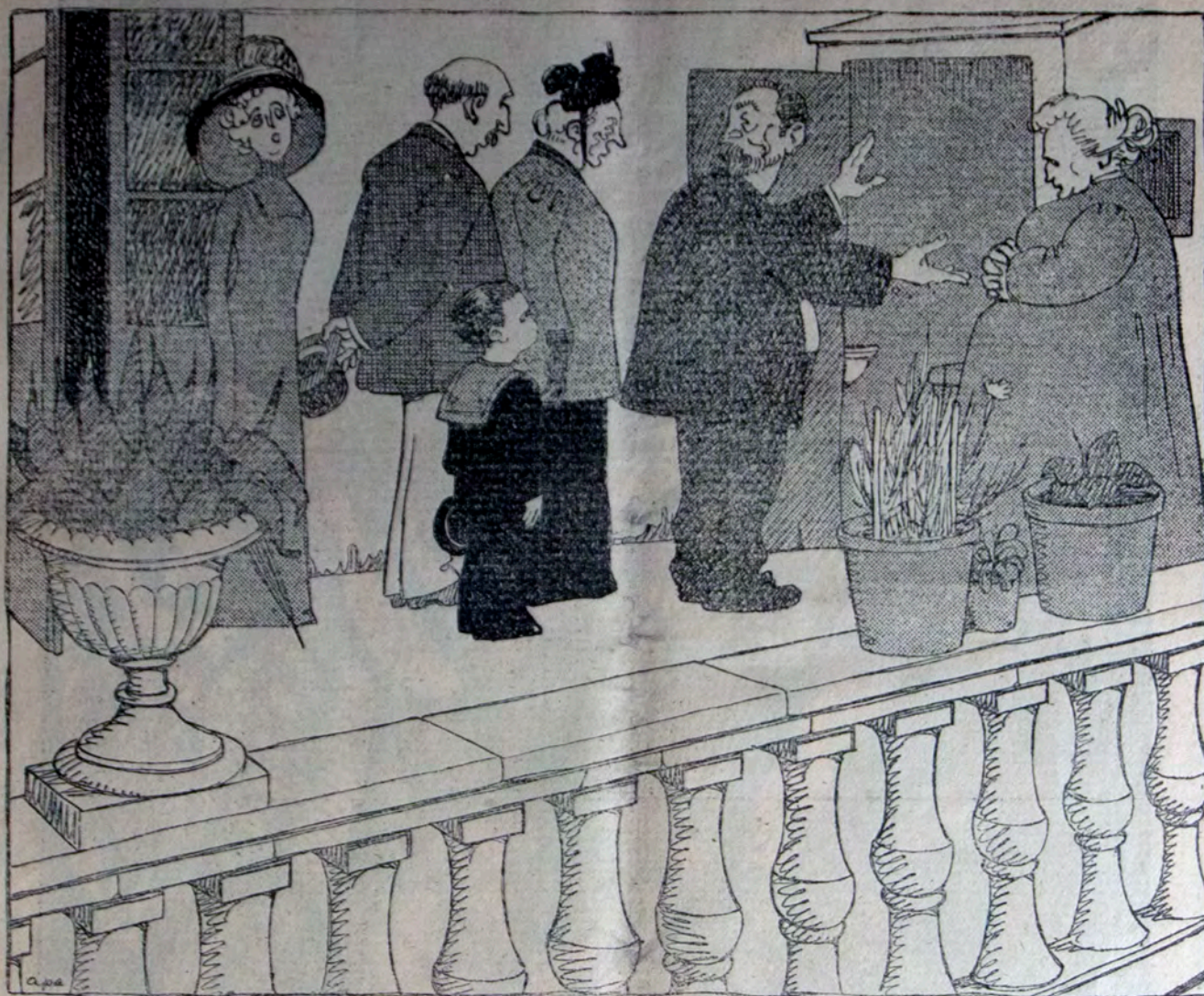
MONTRANTE LA DOMON