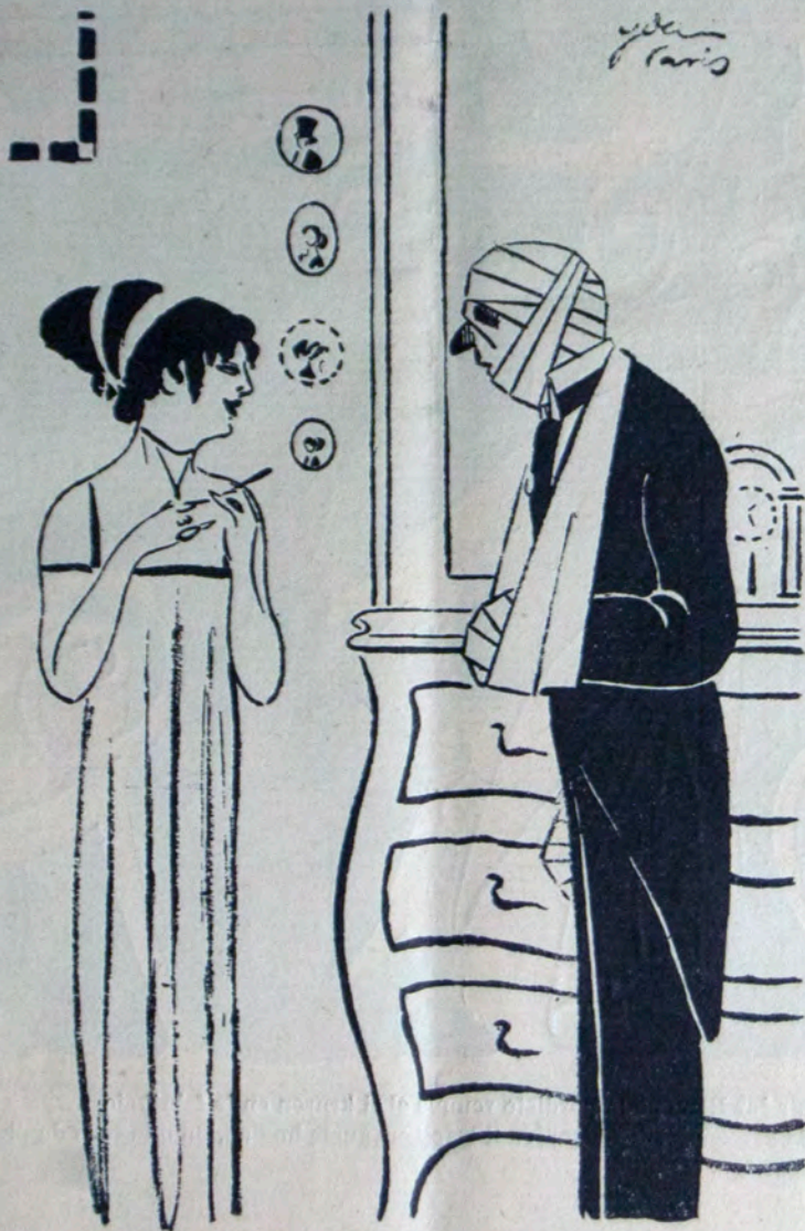
— Neneese ke vi diru, kio okazis al vi; vi elpensis aereoplanon.

— Mi iras al Parizo por reveni kun la karavano profitante la rabatbileton!