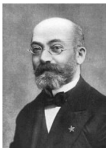
L. Zamenhof. Creador del esperanto.

En 1887, el oftalmólogo Lázaro Zamenhof publicaba en Varsovia La lengua internacional bajo el pseudónimo de Doctor Esperanto. Tras diez años de trabajo había conseguido establecer las normas básicas de una lengua de comunicación universal , probando la validez de la misma en textos de carácter literario que él mismo había traducido o generado. La popularidad del invento llevó al esperanto a obtener una gran número de hablantes en las primeras décadas y en 1905 se convocó el primer Congreso Universal de Esperanto. Hoy en día, pese a que el número de esperantistas ha ascendido – se estima – a dos millones, la posibilidad de una lengua única de comunicación se concibe como una utopía , aunque los defensores del esperanto ven el futuro de la lengua de Zamenhof con gran optimismo.