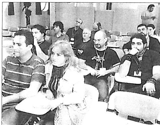
Los primeros participantes del encuentro, en la presentación del evento.

«No es difícil aprender este idioma», dicen algunos de estos esperantistas minutos antes la sonena malfermo (la inauguración