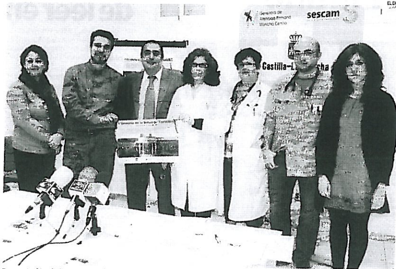
Presentación de la I Semana de la Salud de Tomelloso, que se celebra del 19 al 23 de abril.

Leal agradeció el interés y el esfuerzo de los profesionales sanitarios por organizar este tipo de actividades de educación para la salud, cuyo objetivo final es evaluar y fomentar hábitos saludables