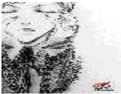
El la ĉina: Hongjia

La du gividantoj rigardis unu la alian, la plumo de la raportisto haltis en la aero, kaj nur kamerao laŭvere registris la ridon de la heroino.