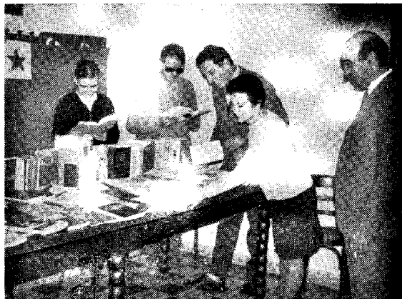
Esperantistoj de la Grupo Frateco pretigas la Ekspozicion

Li rakontis al ni kiamaniere li kaj familia spertis tiun senton de frateco dum sia vojaĝo tra la Balta Maro, kaj prezentis filmon kaj diapozitivojn per kiuj li pruvis al la neesperantista publiko kiamaniere ili estis akceptataj en ĉiuj landoj de la tieaj samideanoj, pro kio ili multe pli ol la ceteraj kunvojaĝantoj povis ĝui la vojaĝon ĉar ili ĉie estis en familia medio.