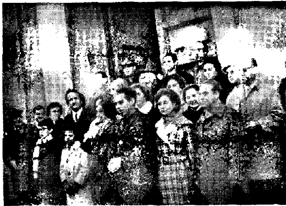
A la salida de la Misa en la Iglesia de Santa Ana, miembros del Grupo de Valladolid nosan para BOLETIN