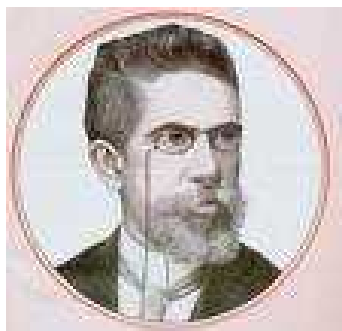
Machado de Assis (1839-1908)

Ĉirkaŭ sia trideka aĝojaro, Joaquim Maria Machado de Assis (Rio, 1839-1908) eksuferis la unuajn atakojn de epilepsio. Oni povas facile kompreni, kion tio signifas, se oni konsideras la