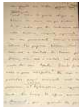
Faksimilo de paĝo manskribita de Machado de Assis

Eble ĝia plej fama kaj reprezenta ĉapitro estas la 7-a, nome "La deliro", kiun ni prezentos al la legantoj de "La Karavelo" en la numero 3 de ĉi tiu literatura revuo, por antaŭĝuo de la tuta verko.