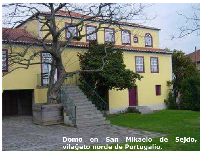
Domo en San Mikaelo de Sejdo, vilaĝeto norde de Portugalio.

Perturbita, ĉagrenita, malsana, senmona, kaj finfine blinda, Kamilo ne plu povis verki. En la 1-a de junio 1890 mempafis sian kapon, mortante lante en agonio, en sia verkejo de la domo de San Mikaelo de Sejdo.