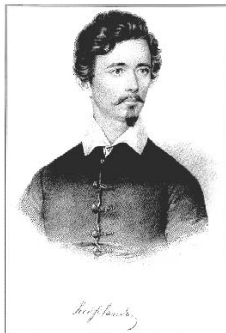
Sándor Petőfi (1823-1849)

Polveron, kiu staras unusola, forblovas pita vento, elspireto; sed se polveroj kunfandiĝas kreske, se la polveroj formas fine rokon, eĉ tempestego ĝin ne plu movetas! Pripensu tion, ni hungaroj disaj, kion mi diris – nova ne, sed vera. La skua vento de l' eventoj nun ne blovas momente, kaj ĉiuj polveroj senĝene kuŝas en sekura loko; sed se atakos vento antaŭ ol ni fandiĝus, ĝi nin ĵetos poreterne en ĉiujn partojn de la mondo vasta, kaj ni neniam povos nin trovi. Ni strebu! La jarcento ja gravedas, naskiĝos tagoj grandioze gloraj, danĝeraj tagoj de la mort' kaj vivo. Ni plektu manojn, por ke ni ne timu tremante, se alvenos la gigantoj! Ni ĵuru per ĉi man-en-mano sankta; ni ĵuru fidon, ho nacio kara! Kiu unua donos manon, tiu havu rekonon, dankon kaj gloregon; Kiu akcepti ĝin hezitos? Kovru polvojn de tiu la malbenoj ĉiuj, kiujn sur niaj tomboj idoj plantos anstataŭ florojn de estimo. Idoj, ni poreterne kiujn fikripligis.