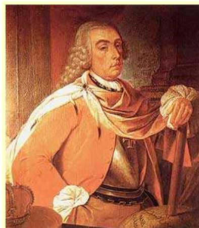
Don Jozefo Reĝo de Portugalio (1714-1777) (PT: Dom José) [dõ jhu'ze]

Ĉe tiuj ĉi festoj, severeco ne regis la lastajn etiketojn. Alia kialo por sin ĝojegi. Oni povis laŭvole tute senmoniĝi per aĉetado de luksaj roboj, ornamaĵoj kaj harararanĝoj. La brodaĵoj kaj brokaĵoj, veluraĵoj kaj silkaĵoj el eksterlando tajlitaj je la franca modo, brilegis kvazaŭ stelaro el perloj kaj diamantoj 7 . Sur la plej riĉaj kostumoj kun plej okulfrapaj koloroj malvolviĝis la frizitaj bukloj de pudritaj perukoj. La damoj vante elmontradis la graciecon de siaj belmovoj, kaj tufoj; laŭ la kapricaj tondofasonoj, kiuj enkadrigis siajn belajn ovoformajn vizaĝojn, ili ridetis al la ĝentilaj fanfaronistoj, kun siaj okuloj plenaj de promesoj entuziasmigantaj eĉ la timemulojn.