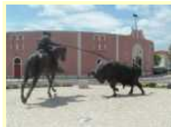
Nuna toreejo de Salvatera kaj statuo omaĝanta la toreadon.