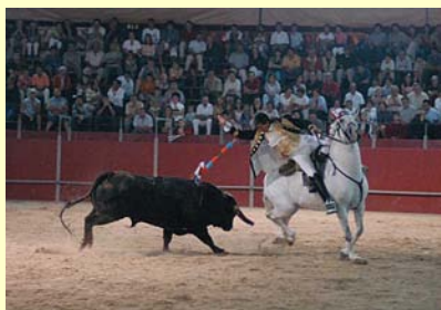
Toreado sur ĉevalo, la kutima en Portugalio.

Kelkaj taŭroj estis pikitaj. Oni denove malfermis la virbovarejan pordon, ellasante nigran kornohavan beston, kiu impetis en la arenon. Jen vera cirkbovo. Longaj kornoj ĉepinte volvitaj supren, maldikaj nervozaj kruroj, indico de leĝereco, rapidaj kaj abruptaj movoj — antaŭsigno de eksterordinara forto. Tuj post atingi la arencentron ĝi haltis kvazaŭ blindigita, skuis la kapon nerveme, forte skrapegis surgrunde, kaj ellasis minacan muĝadon tra la silento postvenanta la manfrapadojn kaj ekkriojn de la spektantoj. Post nelonge la incitistoj transsaltinte la palison tuj forfuĝis pro la miriga rapideco de la besto, kaj du aŭ tri mortontaj ĉevaloj montris vundspurojn de ĝia furiozo.