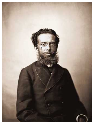
Machado de Assis (1839-1908)

Joaquim Maria MACHADO de ASSIS [j'hwakim ma'ria ma'shadu da'siz] (1839-1908) naskiĝis en Rio de Janeiro, kaj mortis en la sama urbo. Li estis brazila romanisto, rakontisto, dramaturgo, kronikisto, poeto kaj ĵurnalisto. Inter aliaj, li estis amiko de la altstara brazila verkisto José de Alencar (1829-1877). Machado de