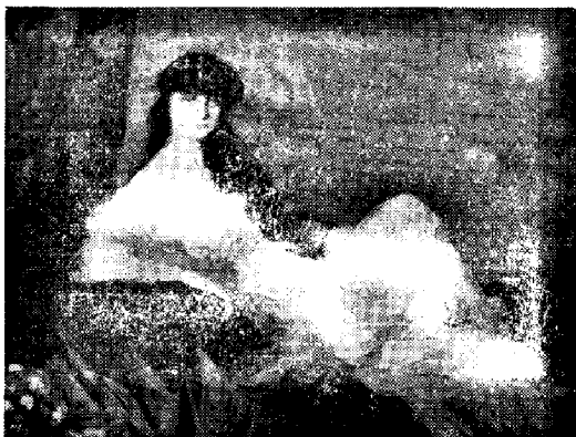
Grafino de Noailles