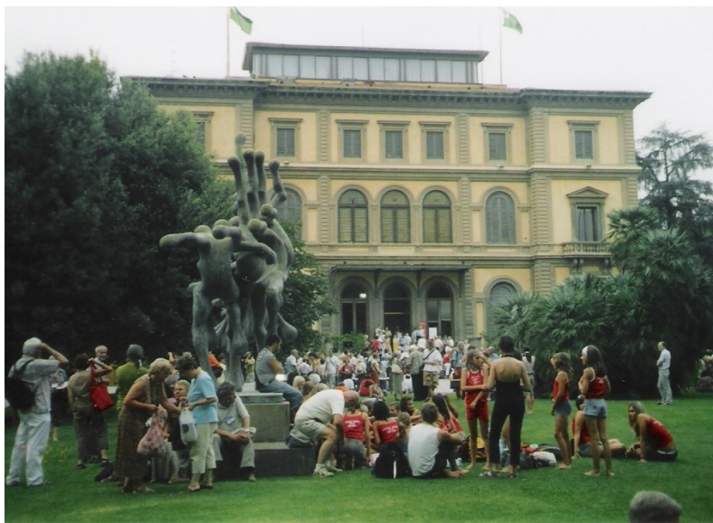
La kongresejo en Florenco