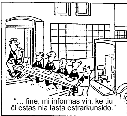
“... fine, mi informas vin, ke tiu ĉi estas nia lasta estrarkunsido.”

La organiza skipo, kunordigita de gesroj Eon, laboris bonege kaj efike. Romano kunlaboris cele al paroliga uzado de la lingvo, prezentante al studgrupo tre multajn diafanaĵojn pri la lingvoj en la mondo: originajn de parolkapablo, lingvaj kaj skribajn evoluadojn (de ŝtono al komputilo), etimologiojn, politikojn, ligvinventojn, ktp.