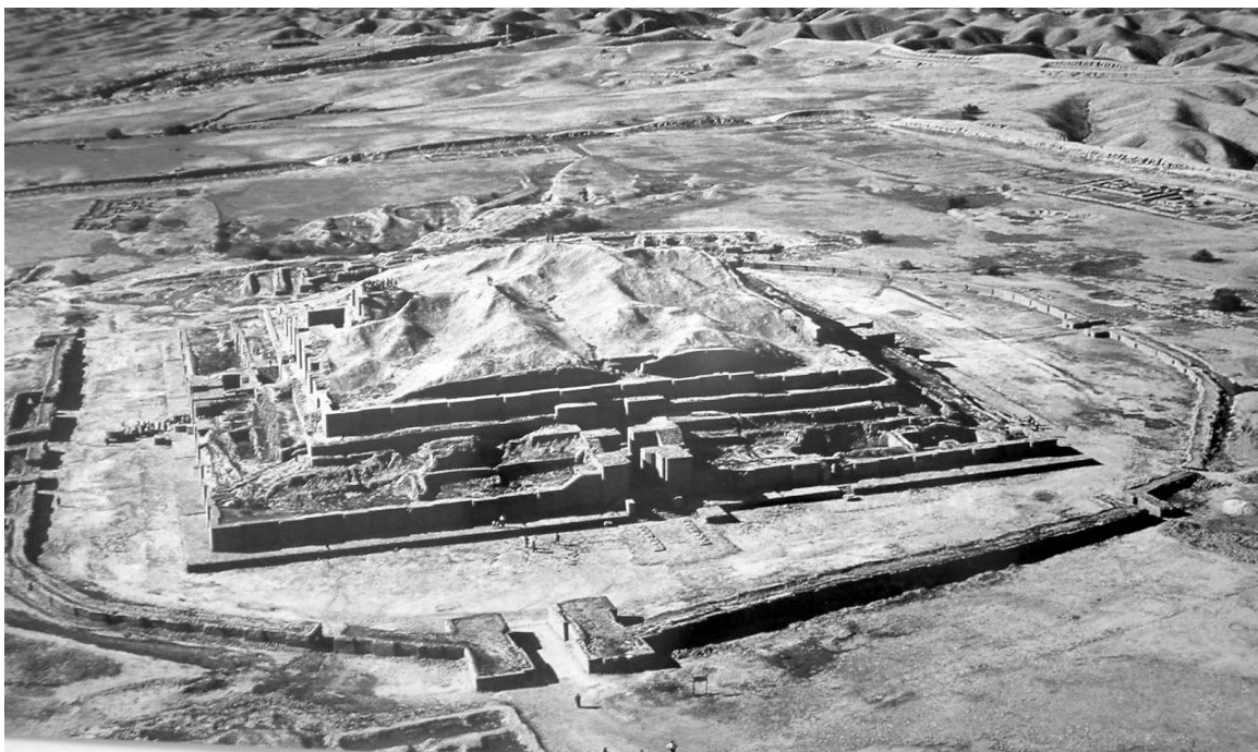
Panoramo de Zigurat-e Ĉogazanbil

Ĉogazanbil la suna preĝejo al ĉiele ankoraŭ staras, pro tio ke kvazaŭ silk-preĝoj estu la kovro de Di-amantoj kaj blankaj flugantoj lernu flugi ĝis la finosupro. Rigardu la sunan preĝejon elkore, tiam Di-radiojn vi vidos en ĝi brilantaj.