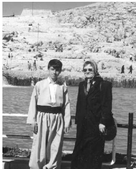
Foto: En Ĝavanrud kun kurda junulo