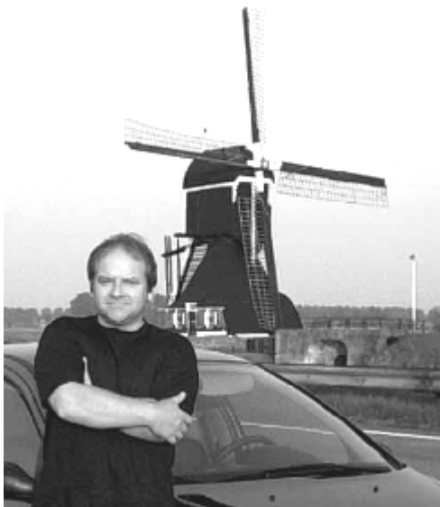
Survoje al Roterdamo

kursgvidanto, klubestro, fondis kaj estris junularan sektion de nia landa asocio, organizis klerigejon por junaj esperantistoj kaj internacian someran junularan E-lernejon, esperantistajn balojn kaj karnavalojn... Al mia E-kurso tiam aliĝis ankaŭ junaj muzikistoj, kiuj opiniis, ke Esperanto estas simila internacia lingvo kiel la