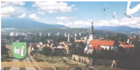
Nové Mesto nad Váhom: La plej malnova simbolo de la urbo devenas el 16-a jarcento. Ĝi bildigas Virgulinon Mariá kun infano kaj situeto de la preĝejo kun slovaká insigno.

Nuntempe la urbo fariĝis moderna kaj industria.