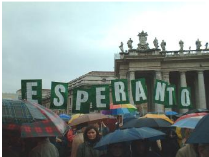
Ankaŭ dum la pasintjara Pasko en la Placo de S-ta Petro, meze de la pilgrimuloj, ĉeestis esperantistoj por omaĝi al la Papo kaj por danki lin pro la esperantlingva bondeziro

URBI ET ORBI pintas per gratifiko de la beno kun plenaj indulgencoj. Jam en la jaro 1939 Vatikano leĝe konfirmis, ke la anima frukto de la papa