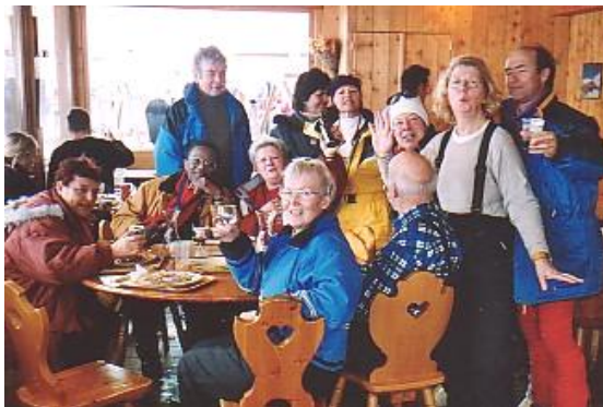
gaja societo dum la 45-a Internacia Fervoĵista E-Skisemajno