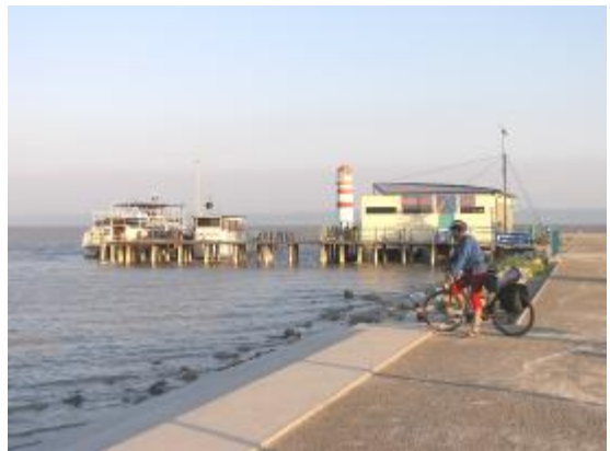
Mateno en la haveno

Vekiĝo sabate frumatene estis denove sub reĝisorado de kuloj. Blasfemantajn dormantojn ili eldormsakigis jam antaŭ la kvina horo. Montriĝis, ke kuloj faris al la biciklistoj bone, ĉar tuj post la eldormsakiĝo komenciĝis priŝprucado de herbejo. Akvo fluis rekte al dormolokoj. Mateno estis