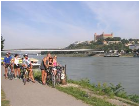
La ciklistoj surborde de Danubo sub Bratislava burgo

Sabate matene komenciĝis ciklovojaĝo en BRATISLAVO de Botanika ĝardeno. Tra la PONTO LAFRANCONI ili venis al dekstra bordo de DANUBO. Mateno estis ideala por komuna fotografado kun Bratislava kastelo kaj novkonstruita ponto. Sur la dekstra bordo kondukas bona vojeto. Dum someraj tagoj multaj loĝantoj el ĉefurbo ĉi tie bicikladas, rulglitkuradas kaj kuradas. Ĉirkaŭ la vojeto estas multaj bufedoj. Unua paŭzo estis en ČUŇOVO, kie estas arealo por akvosportoj. En kanalo kun rapidakvo estas konata NIAGARA AKVOFALO, kiu estas teruraĵo por sportistoj. Najbare de la sporta arealo estas tre bela kaj nova galerio DANUBIANA. La partoprenantoj vizitis ĝin kaj trarigardis ekspozicion ene kaj ekstere. La galerio havas