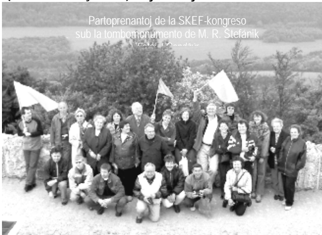
Partoprenantoj de la SKEF-kongreso sub la tombomonumento de M. R. Stefanik