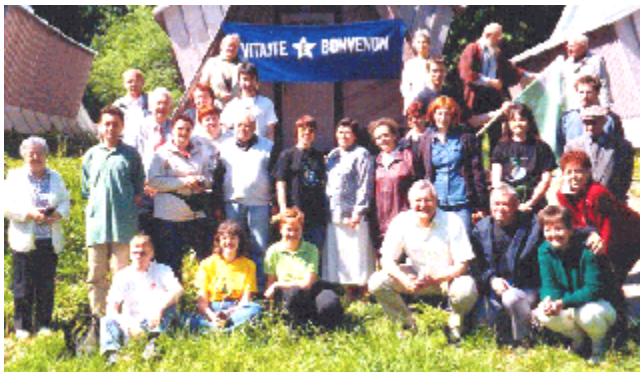
Partoprenantoj de la SKEF-kongreso antaŭ unu el la kabanaj