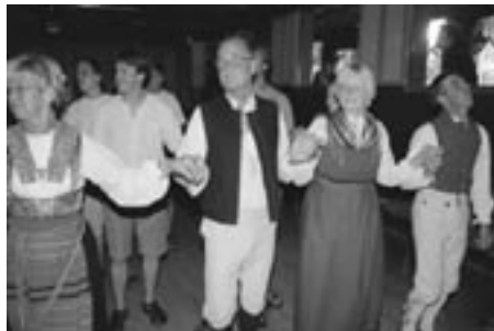
Kurso pri svedaj dancoj...

Jen kelkaj memorajoj el la lasta IJK kiu eble interesos vin se vi ne povis partopreni ĝin. Ĝi okazis en Lesjöfors, malgranda sveda urbo meze de arbaro (kiel preskaŭ ĉio en Svedio). Mi spertis tiam mian duan IJK-n. Nur 170 personoj partoprenis tiun ĉi IJK-n do la etoso estis iom alia ol en Strasburgo (kie ĉeestis pli malpli 400 homoj en 2001!), ĝi estis fakte « hejmeca » etoso kaj do ankaŭ plaĉa. Kiel kutime en E-o- renkontiĝo mi ĝuis la ekkonadojn kaj babiladojn kun aliaj, kaj partoprenis kelkajn prelegojn (pri spiritismo, vojaĝo per biciklo, aroma terapio ktp). Eblis ankaŭ trankvile ĝui la lokon promenante en la arbaro, banante sin en la apudalageto, umante sub la suno en Esperantodomoĝardeno. Komprenoble okazis la tradiciaj diskoteko, por tiu kiu emas danci la tutan nokton, kaj gufujo se