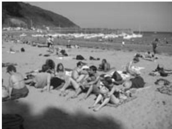
Festo ĉe maro...