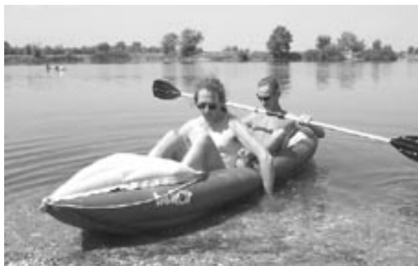
Laca veturigas Andy al la ŝlimejo