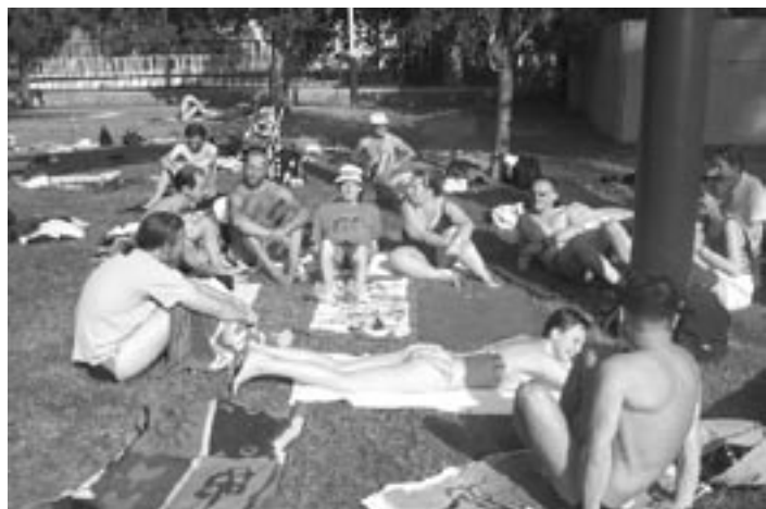
Soleil et bonne humeur : les ingrédients du succès d'IJS

Nous prenons notre repas du soir avant de participer aux jeux (chants, découpages) qui nous permettront de mieux connaître les autres participants.