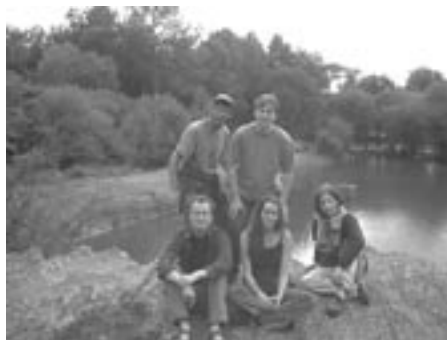
memBre ĉe lago

ĉirkaŭe: eĉ okazis malgrandskala Mela-baniĝo !