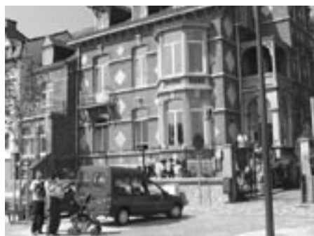
L'auberge où aura lieu la PSKK