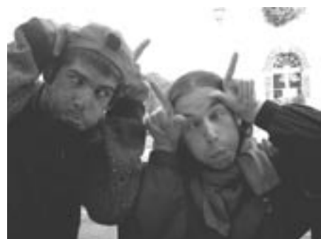
Strangaj bretonaj helikoj

Do, entute estis ripoz-pigra kaj ĝuebla semajno en silentaj kondicoj de la loko, kun malgranda nombro de partoprenantoj sed tiom viglaj ke ilia energio ebligis feston ĉiutage. Dankon al ĉiuj !