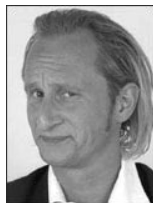
Un namurois célèbre

V e n e z n o m - breux (et préparez vos blagues belges !!)