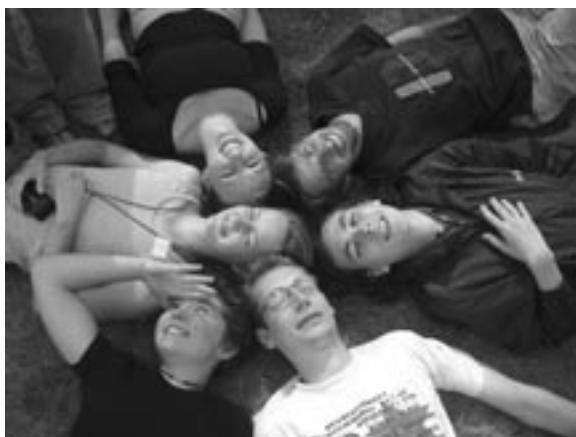
Festo estas granda rondo