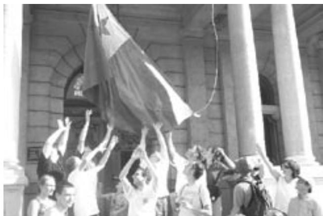
Comme si l'esperanto tombait du ciel

Japonais sous la direction de Ricko. Plus tard et les jours suivants nous irons danser (danses populaires hongroises et russes) chanter (choeur esperantiste), apprendre à faire des bougies, participer à des conférences, perfectionner nos connaissances en occitan, hongrois.. et pour les