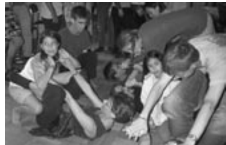
...sed la lernantoj ne vere sukcesas...

en tiu regiono, kaj eble iom pli da krokodilado ol kutime (por mi almenaŭ) ĉar la kongreso havis ĉi jare kelkajn komencantojn. Sed estis interese vidi ilin iom post iom paroli la lingvon kaj fine ni eĉ ne plu havis la monopolon de la babilado kun ili. Ĉiukaze ĝi estis bonega travivaĵo por mi kaj mi esperas por ĉiuj aliaj partoprenantoj. Do ĝis venonta renkontiĝo!