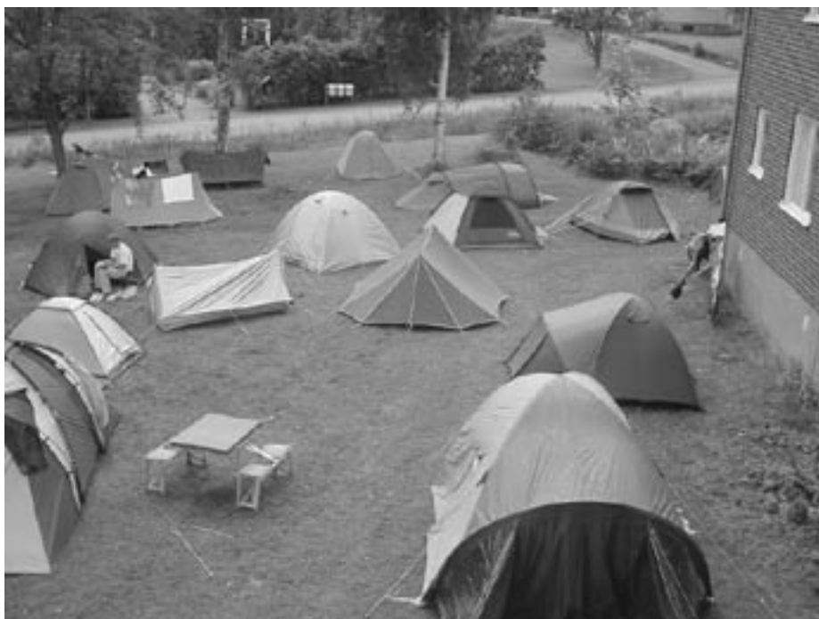
Le memzorgantejo = lieu pour les plus débrouillards ou les moins fortunés