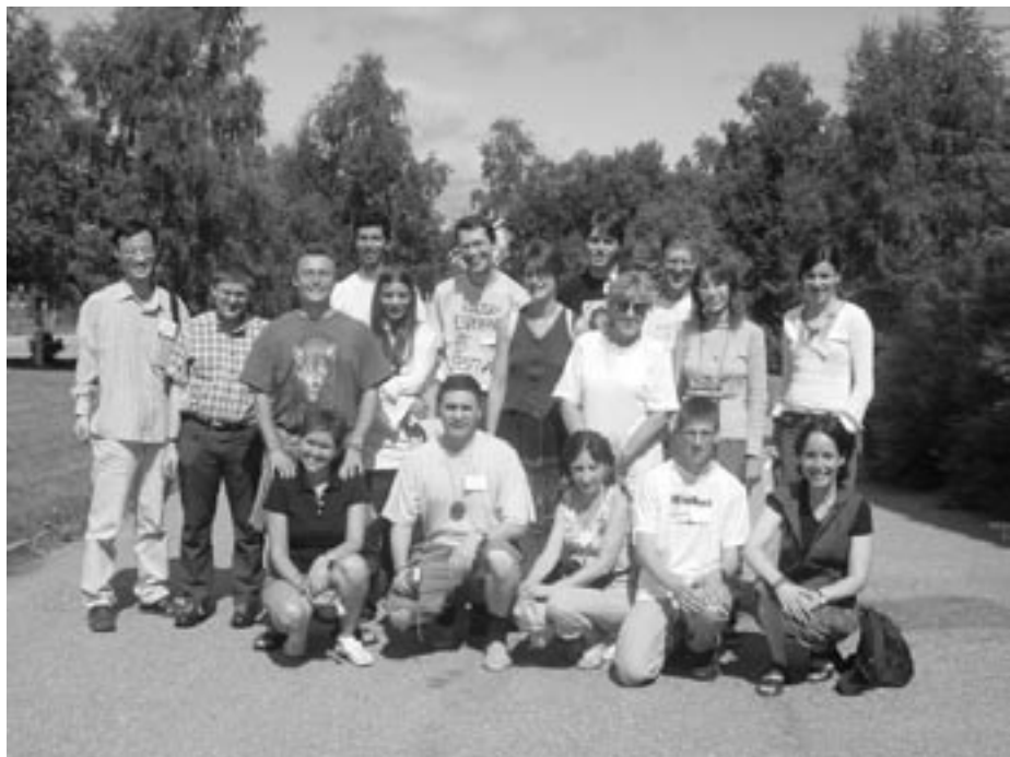
Quelques participants venus d'horizons bien différents

L a découverte de l'Esperanto ressemble à s'y méprendre à celle de la nature Suédoise. Complètement immergé dans un congrès d'Espérantistes, faune indescriptible s'il en est, le débutant a rapidement envie