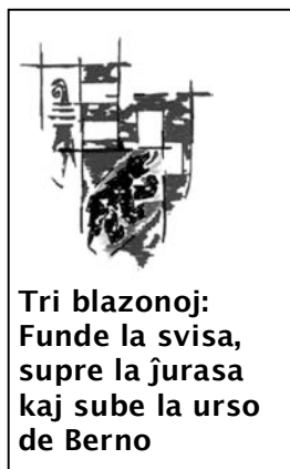
Tri blazonoj: Funde la svisa, supre la ĵurasa kaj sube la urso de Berno

Ĵurasa kantono. En la numero 75 de Etnismo oni povis legi ke la Ĵurasa kantono “naskiĝis la 23-an de junio 1974 post 159 jaroj da batalado”. Vi ankaŭ