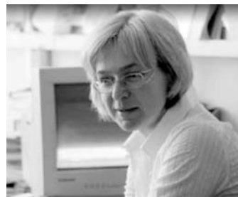
Anna Politkovskaja en sia oficejo.

La 7-an de oktobro grava atestantino de la noĥcia milito, Anna Politkovskaja , estis murdita en Moskvo. Ĵurnalistino ĉe la dusemajna gazeto Novaja Gazeta , ŝi estis forte engaĝita kontraŭ la rusa milito en Noĥcio, kaj de pluraj jaroj plurfoje minacita pro sia denunco pri gravaj malrespektoj de homaj rajtoj, ŝi eĉ estis tri tagojn enkarcerigita en Noĥcio mem. Ŝi verkis librojn pri Noĥcio kaj norda Kaŭkazio, plurajn premiitajn: ŝi ricevis la premion 2003 por ĵurnalismo kaj demokratio de la Organizo por Sekureco kaj Kunlaboro en Eŭropo, la premion de la Fondaĵo Lettre International “por la arto raporti” (2003) por sia libro “Ĉeĉenio, la rusa malhonorigo”, la premion “Kuraĝo en ĵurnalismo” de International