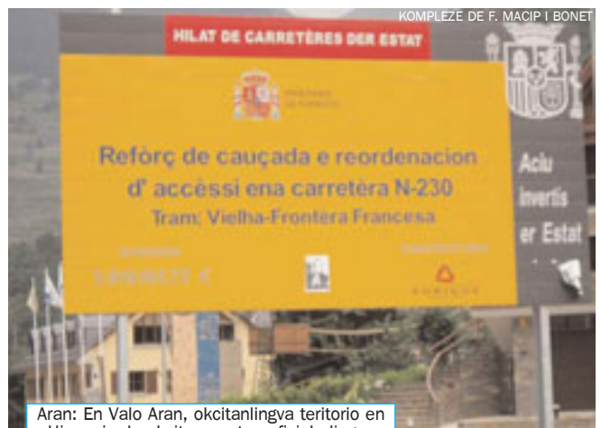
Aran: En Valo Aran, okcitanlingva teritorio en Hispanio, la okcitana estas oficiala lingvo

*** Entute estas 12 milionoj da okcitanparolantoj – E-Vikipedio