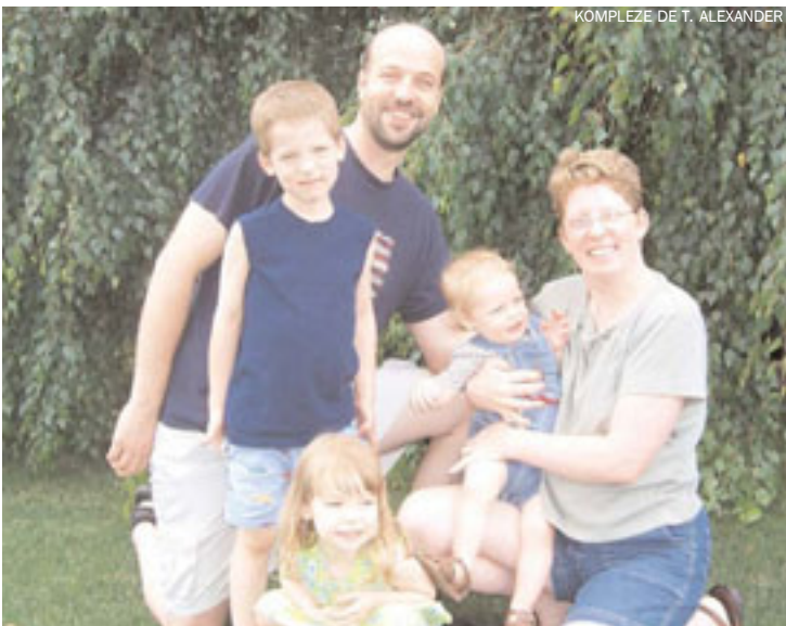
KOMPLEZE DE T. ALEXANDER