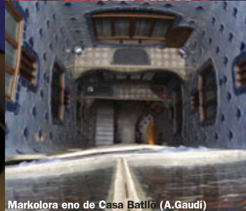
Markolora eno de Casa Batlló (A.Gaudí)