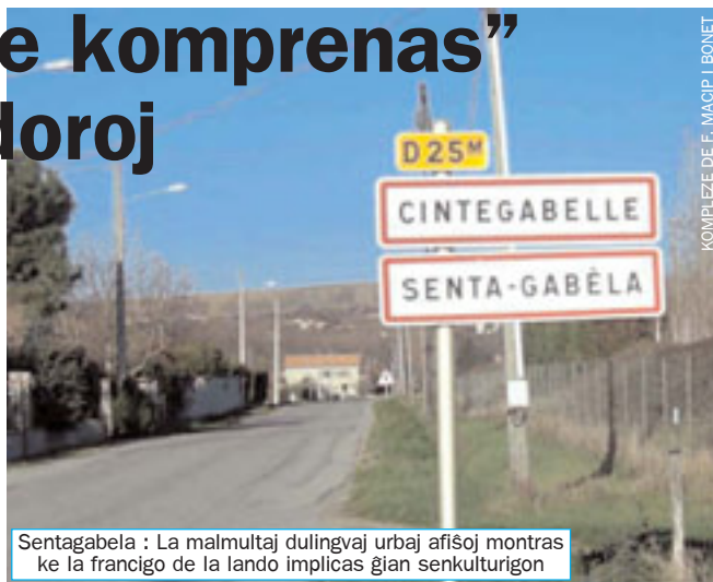
Sentagabela : La malmultaj dulingvaj urbaj afiŝoj montras ke la francigo de la lando implicas ĝian senkulturon

Tre ŝokis min, ke la okcitanlingvanoj tute ne konscias, ke la okcitana estas lingvo. Ili kredas, ke ili parolas nur unu lingvon: la francan. Oni konsideras la okcitanan nur lingva tavolo. Kaj oni ne konas la nomon de la lingvo, oni nomas ĝin “patois” [patüa] france aŭ “patoés” [patues] okcitane. Tiu vorto signifas dialekteron, lingvaĉon, fiĵargonon aŭ aĉan parolmanieron.