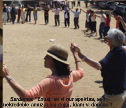
Sardanes: "Enuaj, se vi nur spektas, sed nekredeble amuzaj kaj gajaj, kiam vi dancas!"