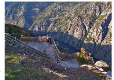
Onte, 29/06/2014, un artigo de La Región facía referencia ó acto ...