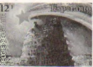
La oficiala belga poŝtmarko eldonita okaze de la UK.

Krome en tiu budo kuŝas varbilaj kaj afiŝoj, per kiuj vi povos varbi novajn membrojn al la Asocio. Ni atendas vin en la akceptejo kaj dankas pro via subteno!