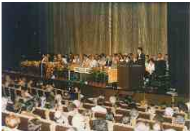
Enrigardo en la salonon Zamenhof

Meze de somero pasos 10 jaroj de nia 81-a UK en Prago 1996. Jes, jam dek jaroj konsumiĝis de nia glora kongreso, kiu estis siamaniere unika ne nur por la enlanda, sed ankaŭ por la tutmonda movado. Estis tie aprobita Praga Manifesto, unuafoje okazis Nitobe-simpozio por aktiva lingvopolitiko kaj eble unuafoje estis por la kongresa kuriero uzitaj komputiloj. La enkomputiligitaj materialoj estis konservitaj kaj eksponitaj en la interreto. Tie oni nun povas vidi materialojn ankaŭ de la sekvantaj kongresoj, sed la Praga estis la unua. Rete troveblaj estas ne nur la kongresaj kurieroj, sed ankaŭ prelegoj de la Kongresa Universitato kaj de la jam menciita Nitobe-simpozio.