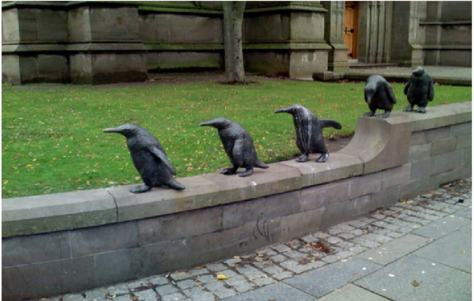
“Pingvenoj” en Dundee (Skotlando). 2005 Skulptis Angela Hunter La sama skulptisto ankaŭ faris aron da aliaj pingvenaj skulptaĵoj en la sama urbo.