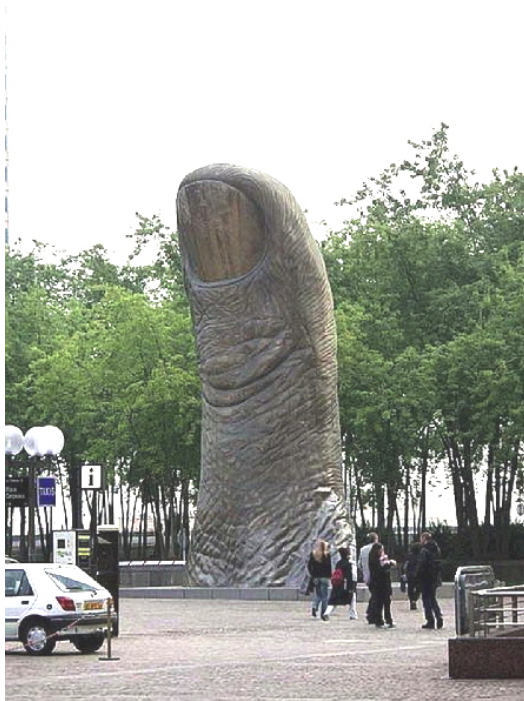
“Polekso” (Parizo), skulptis 1965 César Baldaccini. Altas 12 metrojn.