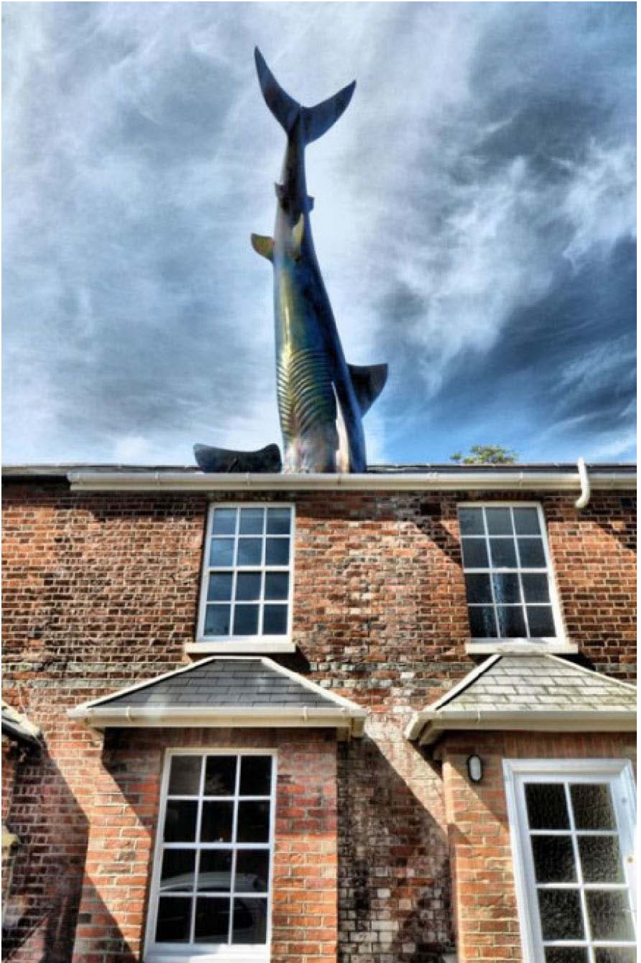
“Sarko”, 1986, en Headington Oxford