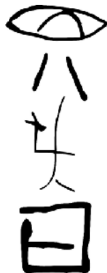
Kelkaj fruaj bildoj

Multaj ekspertoj diras ke la figuroj en la ŝeloj similegas al ĉinaj ideografiaĵoj uzataj plurmil jarojn poste (ĉ. 1500AKE). Tamen, pro la manko de trovo de tiaj ideografiaĵoj el la interaj jarcentoj, aliaj ekspertoj opinias ke temas nur pri hazardaj figuroj sensignifaj.