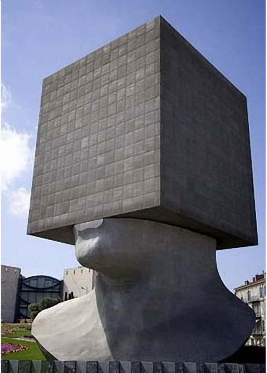
“Kapo Meditanta”, en Nice, Francio