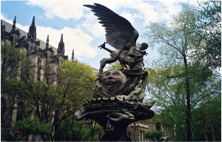
“Pac-Fontano” ĉe Katedralo de Sta Johano la Dia, en la urbo Nov-Jorko. Skulptis Greg Wyatt, 1985