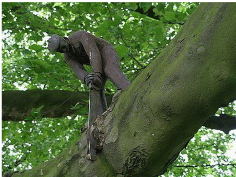
“La segisto” (1989. Amsterdamo)