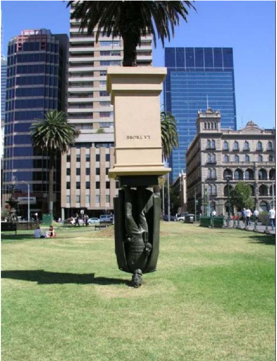
“Charles La Trobe staras sur sia kapo”. Skulptis Charles Robb (2004, Melburno; nun posedajo de Universitato La Trobe, Melburno, Aŭstralio)