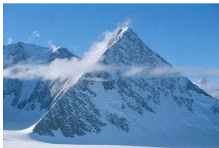
La antarkta “piramido”

de fama Nikola Tesla, diagnozis subterajn kavojn en Visoko. Saša Nađfeji akcentas ke la montego Rtanj estas triflanka asimmetria piramido. La plej longa flanko de la piramido etendiĝas norden. Ĝi estas 3 kilometrojn longa, la sudokcidenta flanko estas 1,5 kilometrojn longa, dum la sudorienta flanko estas 0,75 km. Estas rimarkinde ke la reprezentita rilato estas 4:2:1 — la sama rilato troviĝas en la diferenco de la supermara alteco de la komencaj flankoj kaj la finaj. Rtanj ne nur havas oblikvaĵon saman kiel tiu de La Piramido de la Luno en Meksiko sed ankaŭ la samajn angulojn kiel la piramido de Keopso en Egipto. Esploristo Saša Nađfeji certigas ke oni konstruis nur tri triflankajn piramidojn sur Tero. Unu el ili estas Rtanj, la dua troviĝas en Antarktiko, kaj la