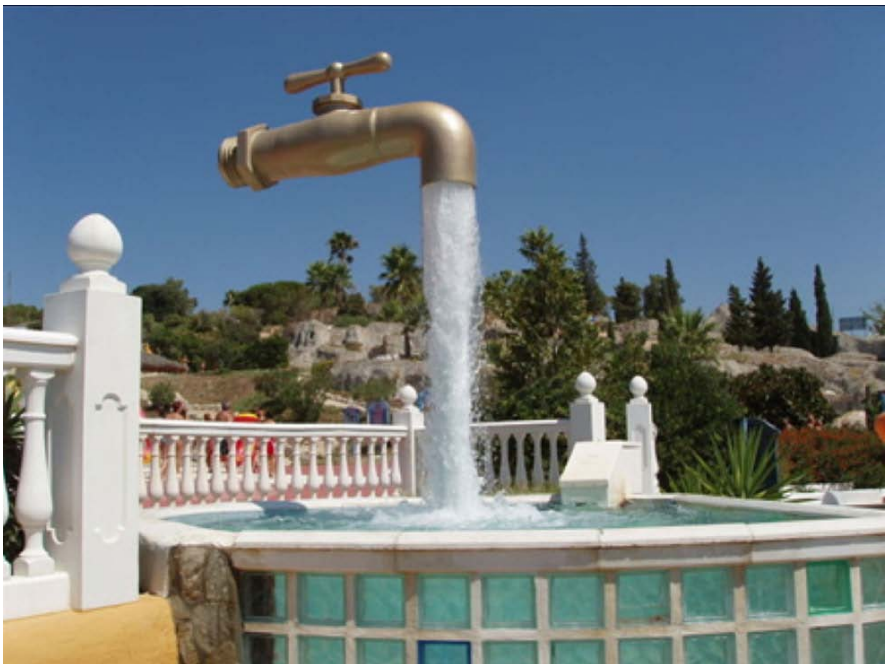
“Magia krano” (Cadiz) [Estas akvotubo kaŝita en la akvofluo.]