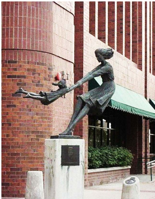
En Salt Lake City, Utah (Usono)