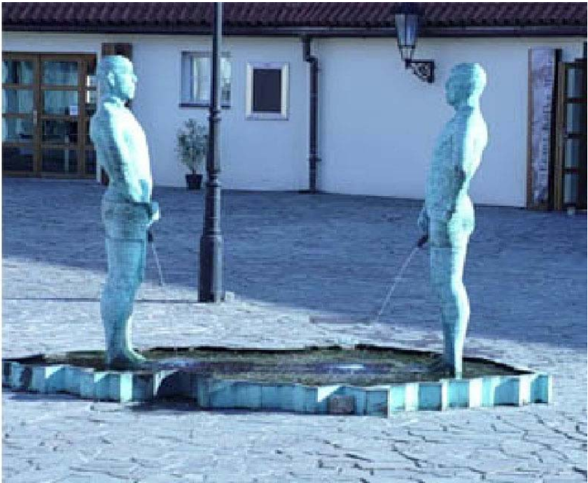
“Pisantoj” (Prago). Skulptis David Cerny, 2004. 210cm alta