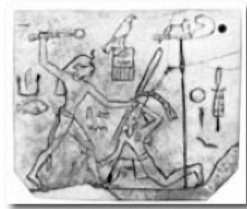
Reĝo (Faraono) Den batas malamikon Bildo sur eburo, el Abydos, ĉ. 3000AKE

Ĉu la ĉisupra bildo sur eburo havas legeblan signifon, aŭ nur ilustras agon de la reĝo? Pri tio ne eblas precize scii nuntempe.