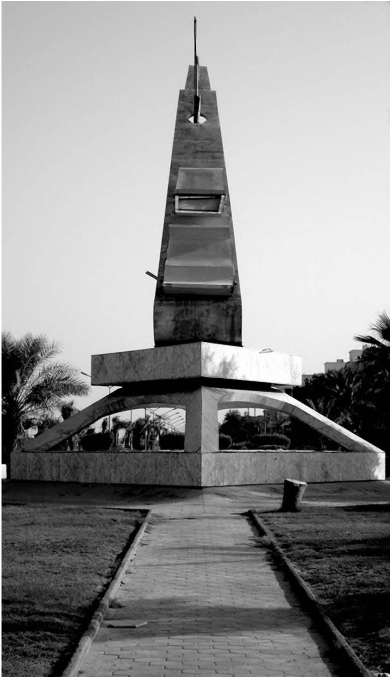
Skulptajo "Rumaihiya" en Kuvajto