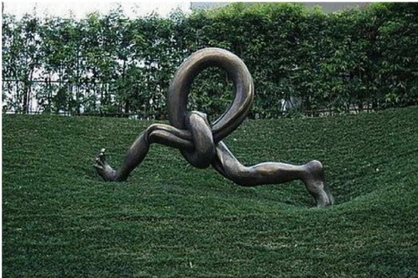
“Kurantaj Kruroj” en Kanazawa (Japanio). Skulptis Ku BomJu