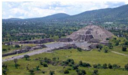
La Piramido de la Luno en Teotihuacán, Meksiko