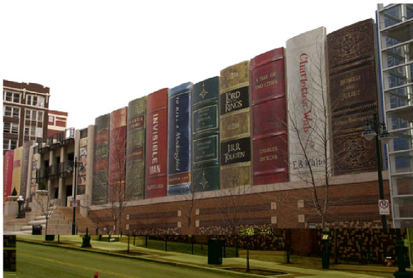
Publika biblioteko en Kansas City, Usono