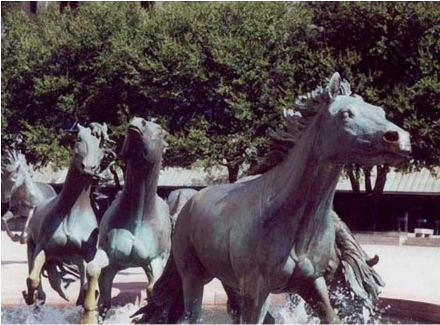
“Mustangoj ĉe Las Colinas”, skulptaĵo el bronzo, de Robert Glen, en Irving, Texas (Usono)