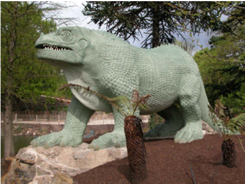
“Iguanodonto” skulptita de Benjamin Waterhouse Hawkins in 1854 (Hawkins nur imagis la formon de Iguanodonto.) Plu staras, en Londono.