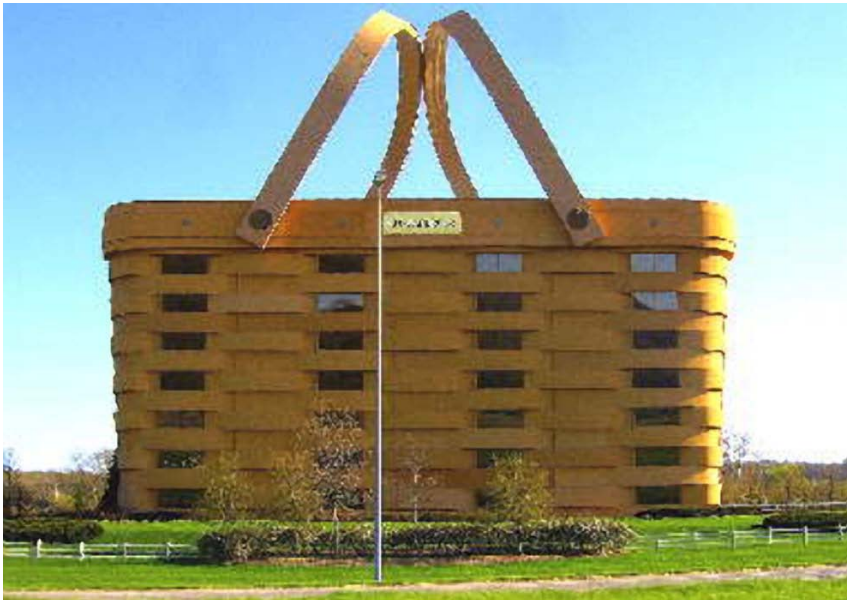
Oficejoj de la Korbofabrikista Kompanio Longaberger, en Newark, Ohio (Usono)