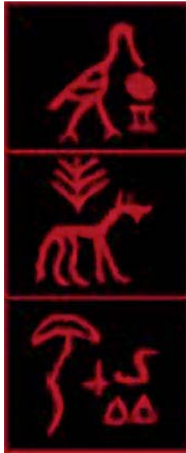
La plej fruaj ĝis nun trovitaj skribobildoj egiptaj, el Abydos, ĉ. 3400AKE

Proksimume samepoke kiel la sumeranoj, ankaŭ en Egipto oni komencis bildoskribon, verŝajne ne sendepende de sumera influo. La du regnoj interkomercadis kaj veturado inter ili estis vigla. Tamen, la egipta skribosistemo evolus laŭ tre malsimila maniero. Dum en Sumero plejparte mankis papero sed abundis argilo, en Egipto abunde kreskadis fragmitoj ( kalamoj ) en Rivero Nilo, Oni faris skribilojn el ili. Krome, la egiptanoj facile trovis metodon pretigi paperon el la sekigitaj kanoj. Do oni faris inkon per miksaĵo de akvo kaj fulgo, kaj desegnis sur papero uzante pintigitan pecon de fragmito. La plej frua plu konservata ekzemplo de prabiloskribo estas sur eburo el tombo en Abydos: