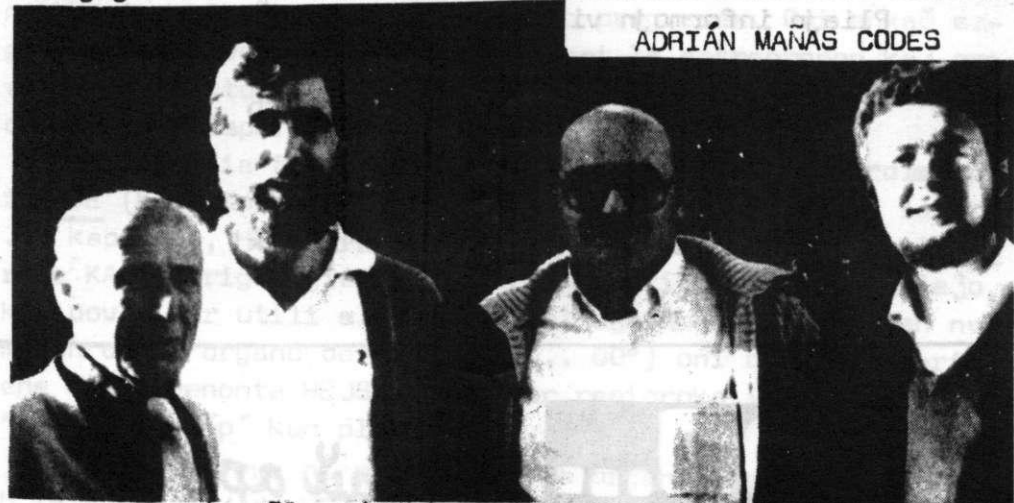
Pluraj LKK-anoj de la kongreso