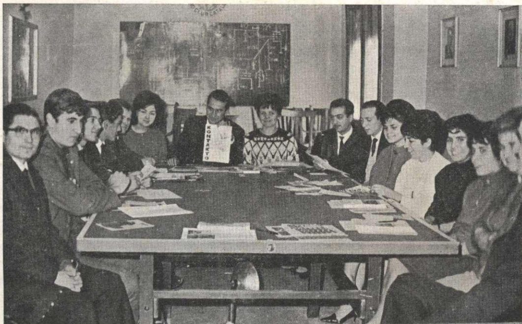
Kunveno de HEJS-estraro en la nova junulara kilubejo.

Arce, 8, 2. o , 4. a - CORNELLA (Barcelono) Hispanujo