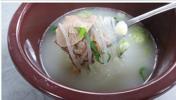
Kokaĵo (supre), seolleongtang (sube)