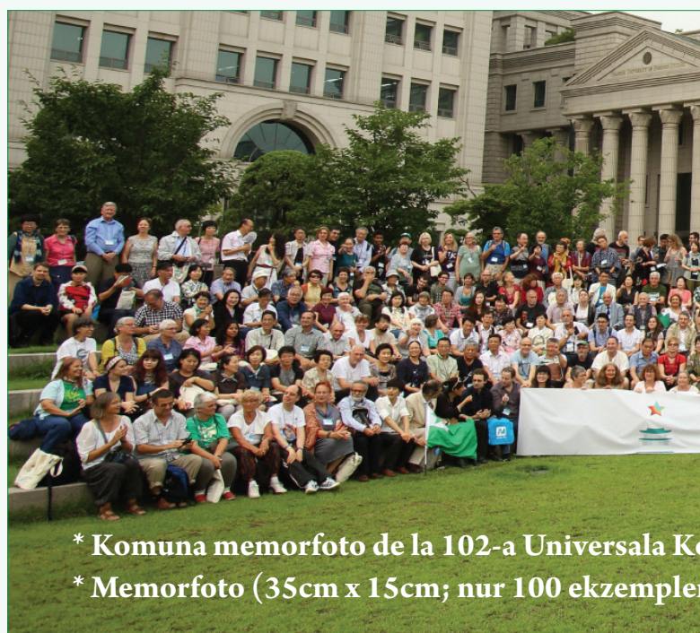
* Komuna memorfoto de la 102-a Universala Kongreso * Memorfoto (35cm x 15cm; nur 100 ekzempleroj)