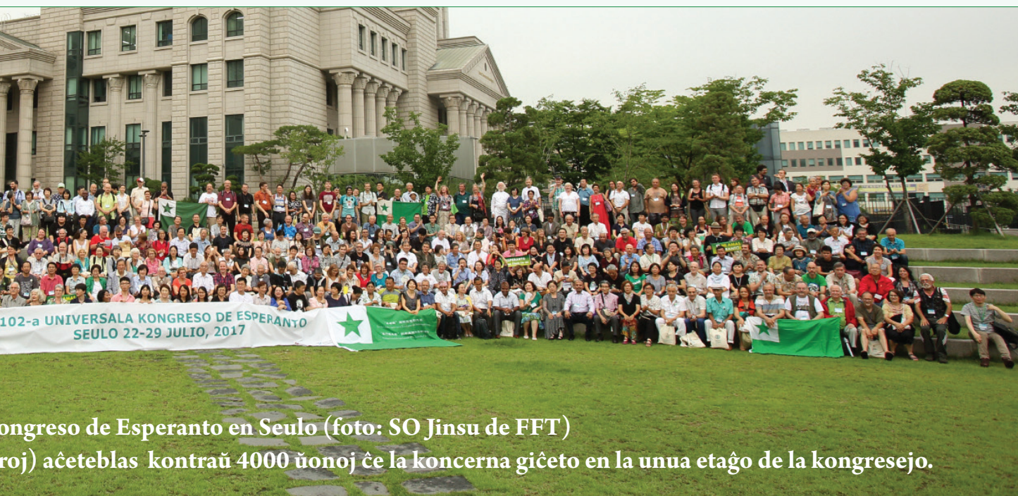
Kongreso de Esperanto en Seulo

roj) aĉeteblas kontraŭ 4000 ŝonoj ĉe la koncerna ĝiketo en la unua etaĝo de la kongresejo.