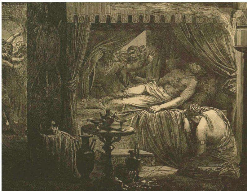
Jen, mortis Atilo, la reĝo de la Hunoj. (La bildo estas el la bildserio de Julio (Gyula) Naue, titolita Popolmigrado )