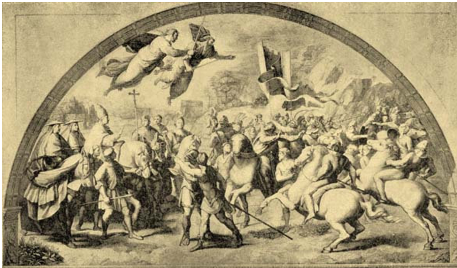
(Atilo antaŭ muroj de Romo – Murpentraĵo de Rafaelo en la Vatikano. Bildodeveno de: http://mek.oszk.hu/00800/00893/html/doc/c400122.htm )