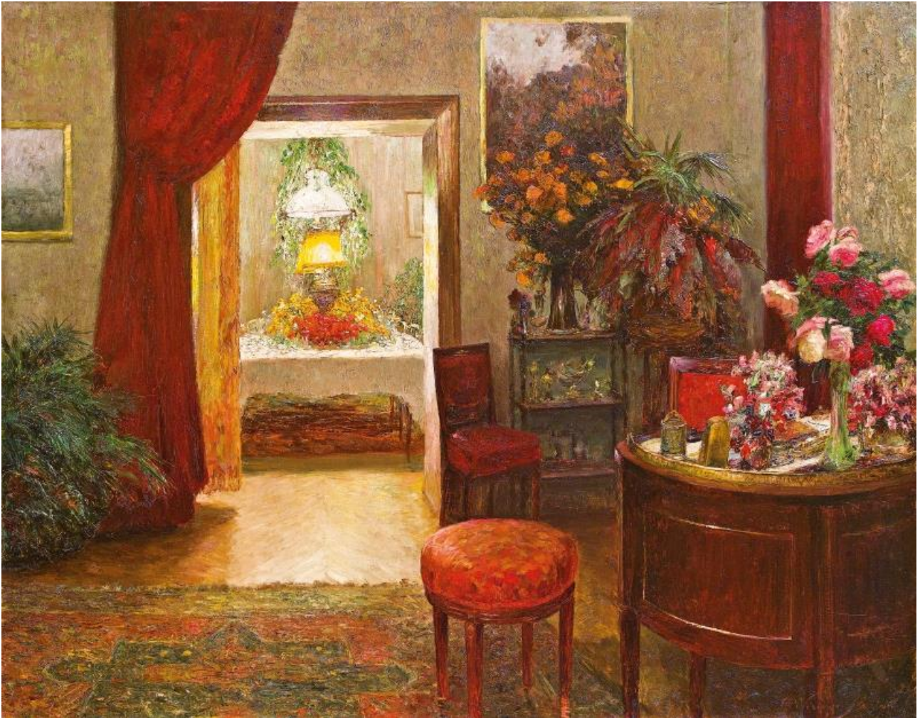
Olga WISINGER-FLORIAN, Interieur mit Namenstischtisch, 1909 Interioro kun Nomfesta Tablo