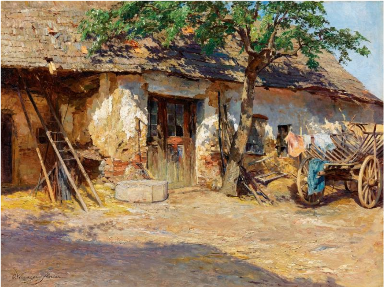
Olga WISINGER-FLORIAN, Schmiede bei Bisamberg, 1894 Forgejo cê la monto Bisamberg apud Vieno