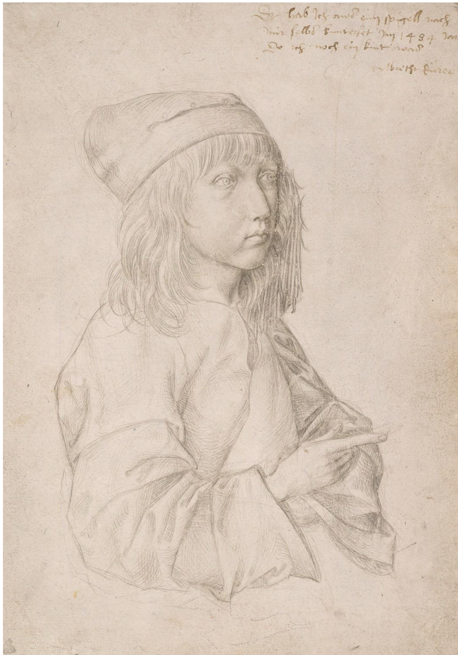
Albrecht Dürer Selbstbildnis als Dreizehnjähriger, 1484 Memporetro kiel 13jarulo Silberstift – Arĝenta krajono