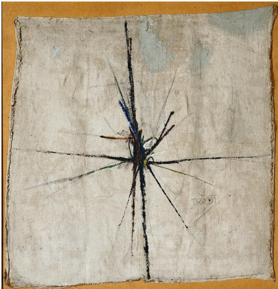
Arnulf Rainer: Zentralisation - Centrigo, 1951 Albertina, Wien. Sammlung Essl

Pliaj informoj: www.albertina.at kaj www.albertina.at/presse .