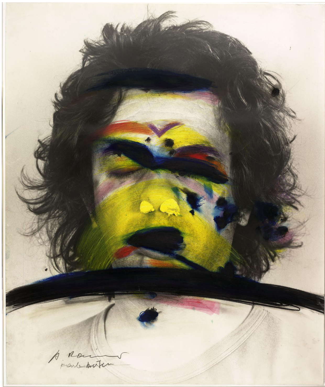
Arnulf Rainer Face Farces: Farbstreifen – Farbstrioj, 1972 Albertina, Wien © Arnulf Rainer