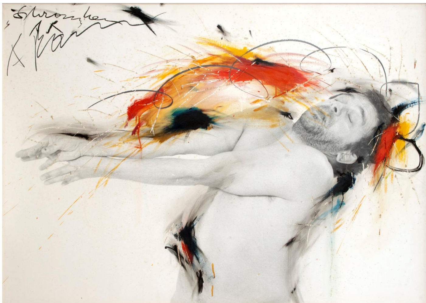
Arnulf Rainer Schranken - Bariloj, 1974-75 Albertina, Wien © Arnulf Rainer