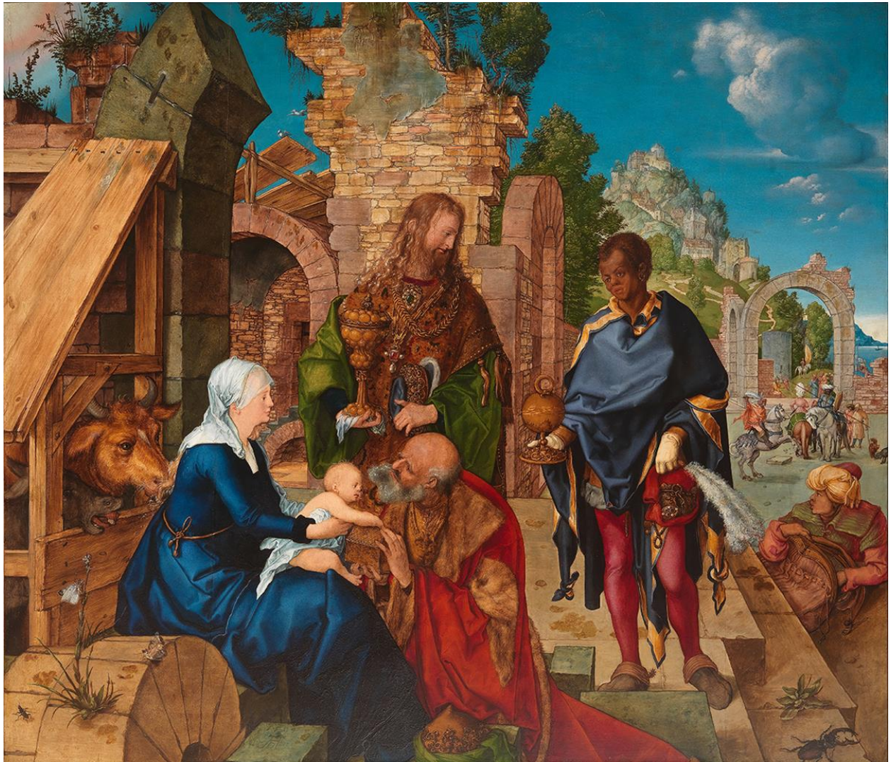
Albrecht Dürer Anbetung der Könige, 1504 Adorado de la reôj Öl auf Holz Oleo sur lino Florenz, Gallerie degli Uffizi