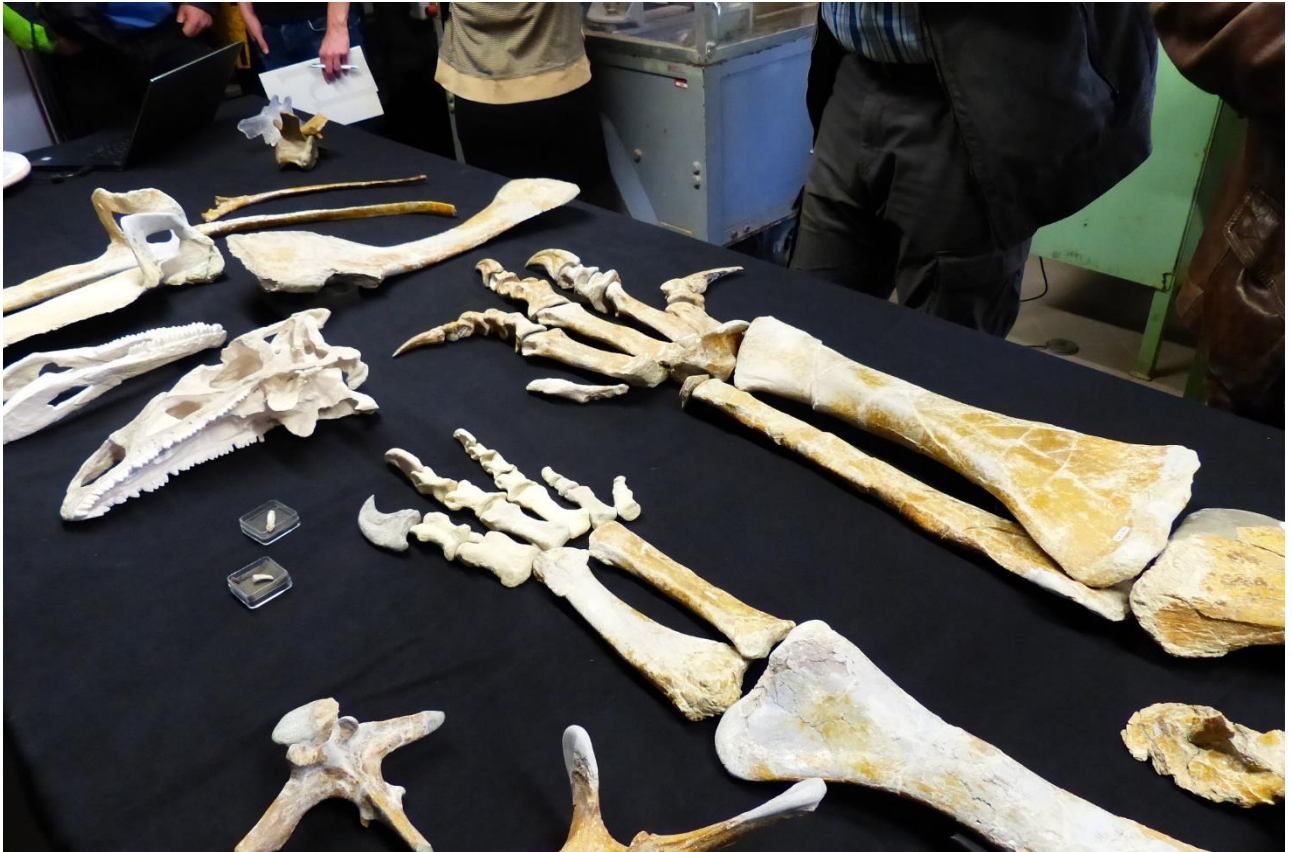
Originalaj ostoj de la 210 milionojn da jaroj aĝa plateosaŭro.