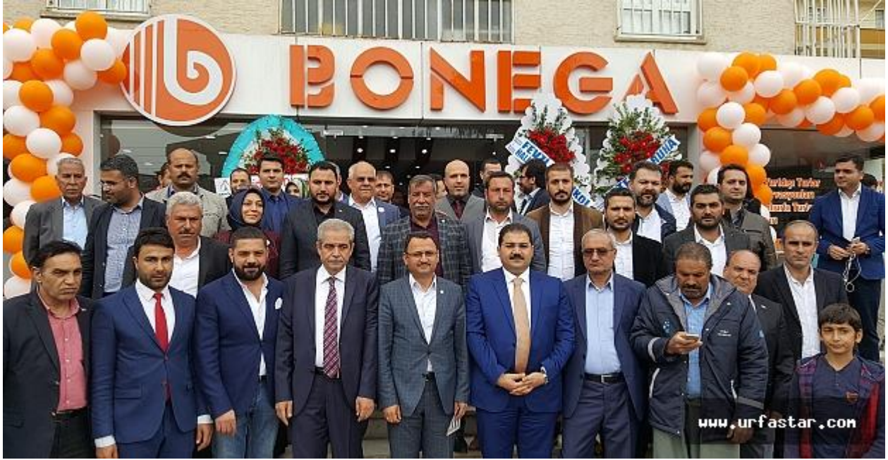
Şanlıurfa'da, bugün hizmete giren BONEGA Acenta şirketi coşkuyla açıldı.